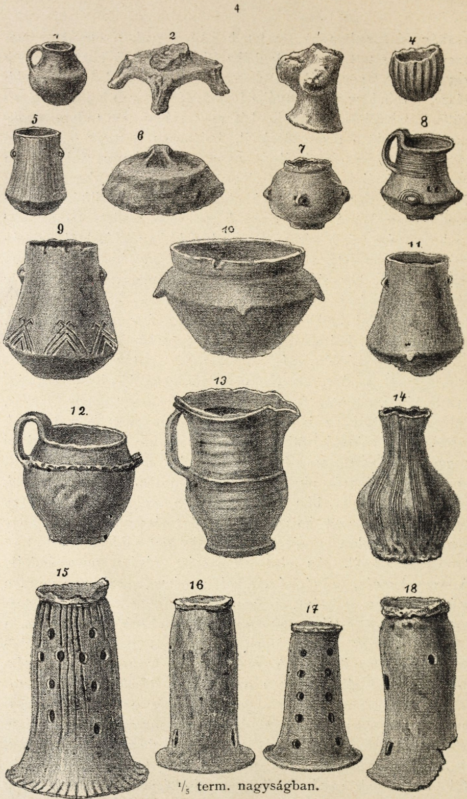
II-IK TÁBLA. CSERÉPEDÉNYEK SZEGEDRŐL.