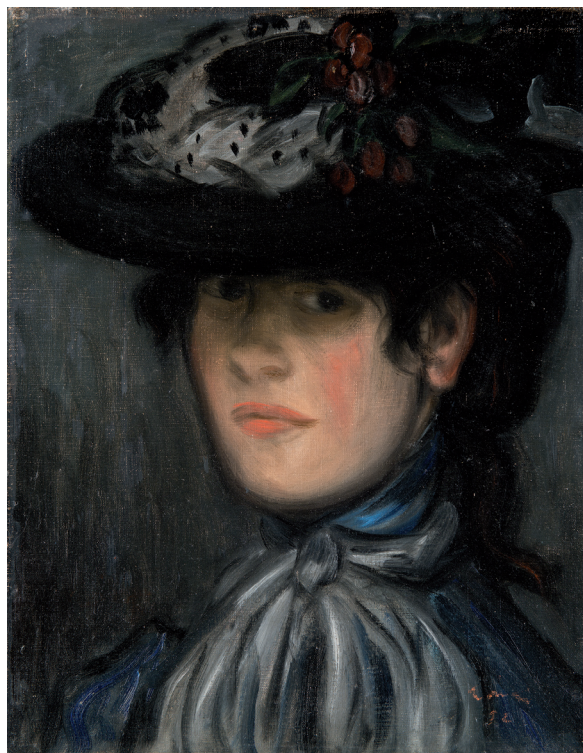
1. ábra. Rippl-Rónai József: Claudine Magyar Nemzeti Galéria tulajdona

Rippl-Rónai József halálának huszadik évfordulóján, 1947 decemberében a Nemzeti Szalon emlékkiállítás rendezett tiszteletére. A katalógusban méret és a tulajdonos nevének feltüntetése nélkül összesen 131 alkotást láthattak az érdeklődők. 28