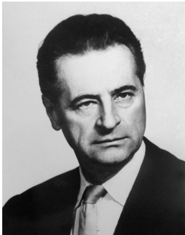
2. ábra. Völgyessy Ferenc arcképe. Magántulajdon.

A képet én 1918 karácsonyán kaptam a nevelő apámtól Rippl-Rónai Józseftől, Kaposváron, ahol én akkor éltem az ő háztartásukban, mint az ő nevelt lányuk. Vérégi kapcsolat is fűzött hozzájuk, mert Rippl-Rónai Józsefné az én édesanyámnak testvére, vagyis nekem nagynéném volt. Ez a kép a leánykori szobám falán lógott, a mosdó felett. Összesen két kép lógott ott abban a szobában a falon, úgy, hogy nem lehet róla tévedés, a másik kép az ágy mellett függött és az egy üvegre festett kis angyalfejet ábrázolt. A mosdó az ágy mellett volt, és a szoba az emeleten. Én 1919 évben mentem férjhez, és kezdetben még egy, vagy másfél évig Kaposváron éltünk. Azután elköltöztünk onnan 1921, vagy 1922 év őszén Budapestre. Budapestre költözésünkkor az a perbeli kép is, és a már említett angyalfejet ábrázoló másik kép is ott maradt Kaposváron, Rippl-Rónai Józseféknél. Nevelőapám Rippl-Rónai József 1927. november 25-én halt meg. Haláláig érintkezésben voltunk vele és halála után is az özvegygel. Özvegye maradt tovább ott ugyanabban a lakásban Kaposváron, de télen fel szokott járni hozzánk rendszeresen. A kép továbbra is ott maradt. Megemlítem, hogy 1927 októberében kiállítani akarta a mester a képet és akkor Budapesten volt az a kép. Akkor csináltattuk rája a jelenleg is rajta lévő brüsszeli ráját és pedig a férjem és én. De nem került kiállításra, mert elkésve ért be, és visszakerült a kép Kaposvárra. Úgy, hogy a mester halálakor a kép Kaposváron volt. A mester hagyatéká-