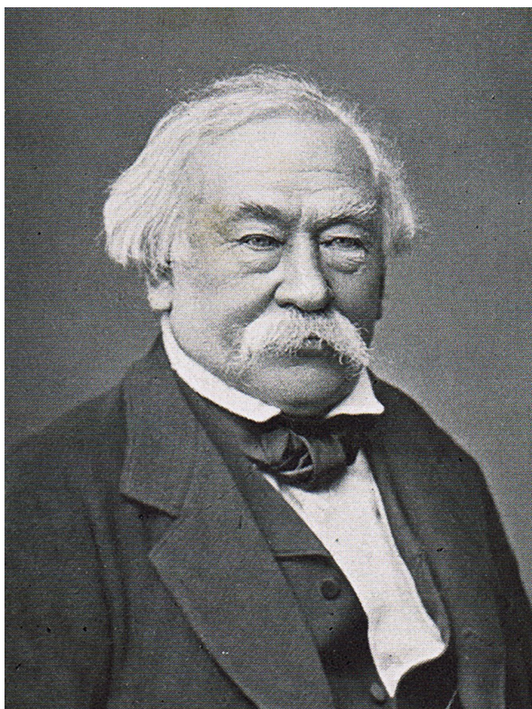
3. ábra. Petzval József portréja

indokolt felhívni a figyelmet arra, hogy az állampolgári hovatartozás kérdése, – mint erre a jogi szakirodalom is int – nem mosható össze az etnikai származás problémájával. 14 Az erre vonatkozó különbségtétel a továbbiakban is fontos támpontot jelent ebben az eszmeifuttatásban.