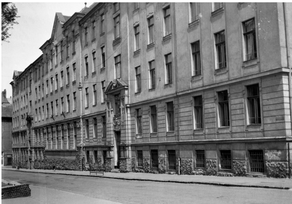
4. kép. A Jurányi utcai iskolaépület: Hámán Kató Leánygimnázium, 1965.

1949-ben a főváros a Jurányi utcai 3. számú iskolaépületét teljes felszereléssel átadta a kultuszminisztériumnak. 35 Ebben az évben a II. kerületi Állami Gizella Leánygimnázium nevet kapta, bár 1950-ben még a Jurányi utca 1. szám alatt Gizella Leánygimnázium néven említették. 36 Majd még ebben az évben átnevezték Koltói Anna Leánygimnáziummá. 37