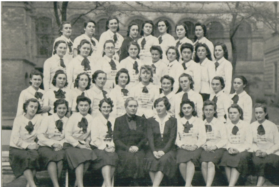
3. kép. A VIII. osztály tanulói 1940-ben. (Freybergerné 1940. Képmelléklet.)

A ballagó leányok magyaros ünnepi ruhába öltöztek, így őrizték a hagyományokat. 11