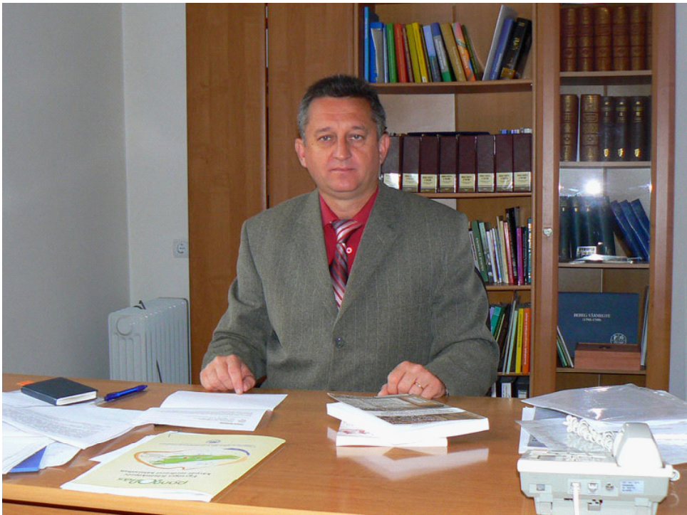
SOÓS KÁLMÁN (1962–2011)