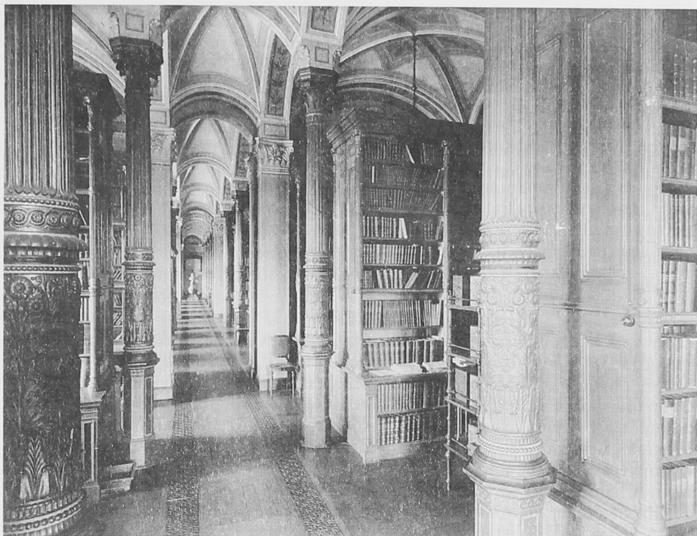
Az Akadémiai Könyvtár raktára a századfordulón