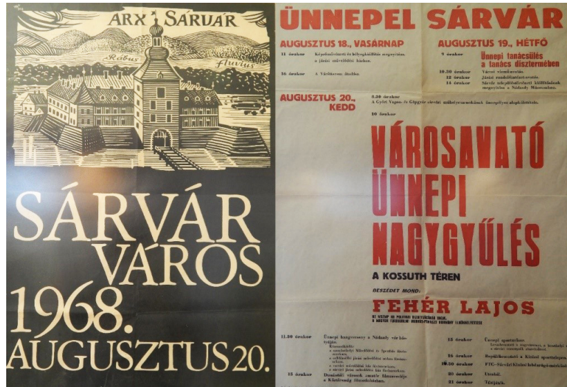
1. ábra: Emlék a sárvári Nádasy Ferenc Múzeum helytörténeti gyűjteményéből Figure 1. Souvenir from the local history collection of the Nádasy Ferenc Museum in Sárvár

Ez azonban nem zavarta írásunk főszereplőjét, aki funkciói alapján kisvárosként azonosította a települést, amelynek ténylegesen azonban még kilenc évet kellett várnia az előlépésre. A különbség nem véltelen: kezdettől fogva volt egy nyilvánvaló eltérés aközött a szemlélet között, amelynek kettősségére jelen sorok szerzői is felhívták már a figyelmet (Pirisi & Trócsányi, 2009). Amíg a mindenkor központi hatalom – időnként csak elvileg, és „némi” következtelenséggel – a településfejlődés eredményeinek elismeréseként tekintett a városi címre, addig a helyi perspektíva – és ezt osztotta Tóth József is – a fejlődés-fejlesztési folyamat részeként, fontos mérföldkőként tekintett a városi rang elnyerésére, amely megnyitotta a kaput a további funkcionális urbanizáció előtt. Ezt a véleményét nyíltan artikulálta szakmai körökben is. A településrendszer hierarchikus szintjeinek vizsgálata az 1970-es évek elejétől része az életműnek. Az 1973-as, a központi szerepkörű települések népességszám-változását elemző tanulmánya például ezekkel a szavakkal zárul: „ Elengedhetetlenül szükséges továbbá, hogy azok a nagyközségek, melyek középfokú vagy részleges középfokú központi szerepkört töltenek be, városi jogálláshoz jussanak ” (Tóth, 1973).