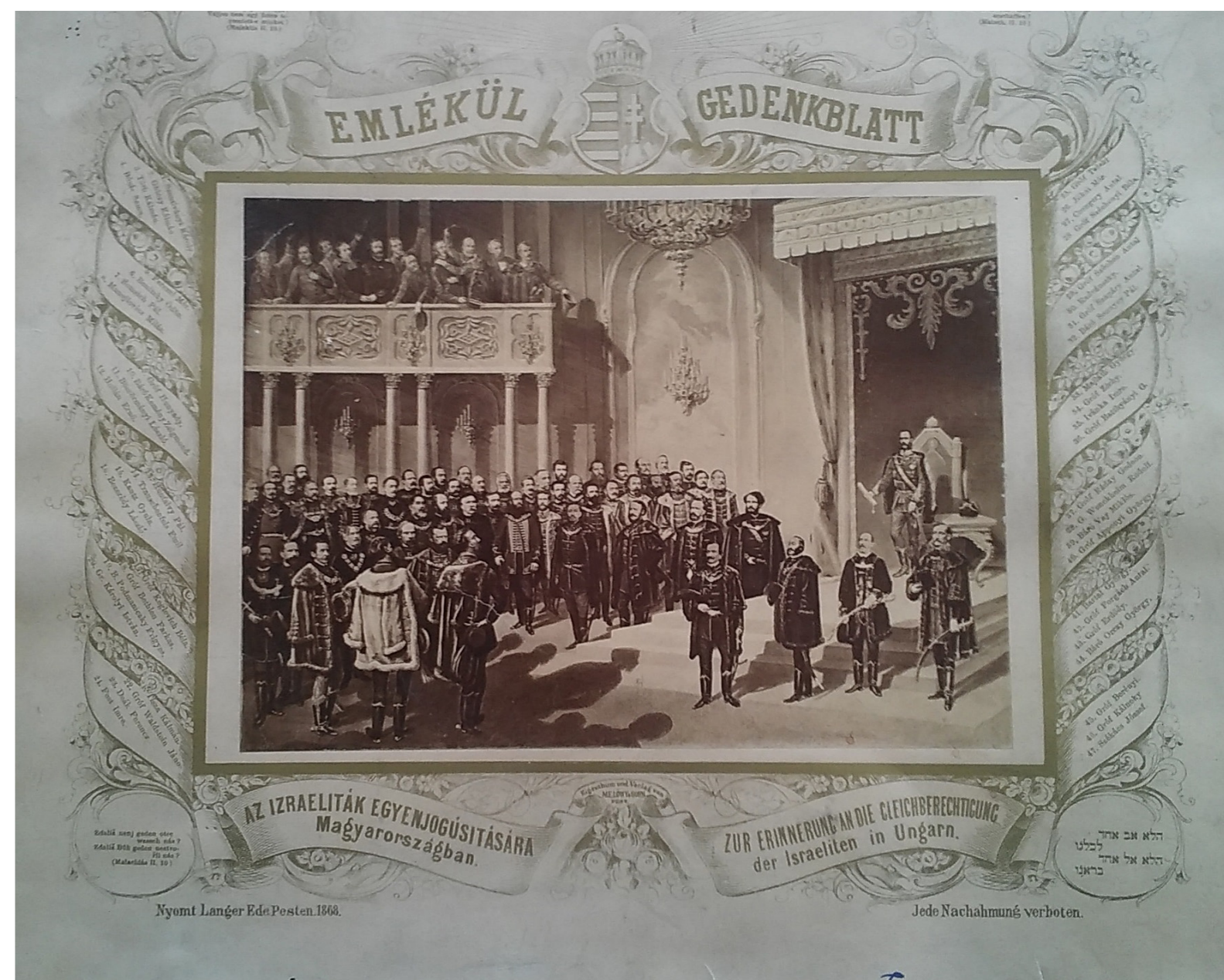
Emléklap az izraeliták egyenjogúsítására (MILEV)

A modern nemzeteszme és a szimbolikus politika fontos elemét képezte a különböző zsidó sajtódiskurzusoknak. A vizsgált problémát a második zsidótörvény orthodox izraelita felekezeti visszhangján - az Egy fővárosi falragasz előtt címmel megjelent vezércikken - keresztül lehet legdidaktikusabban szemléltetni.