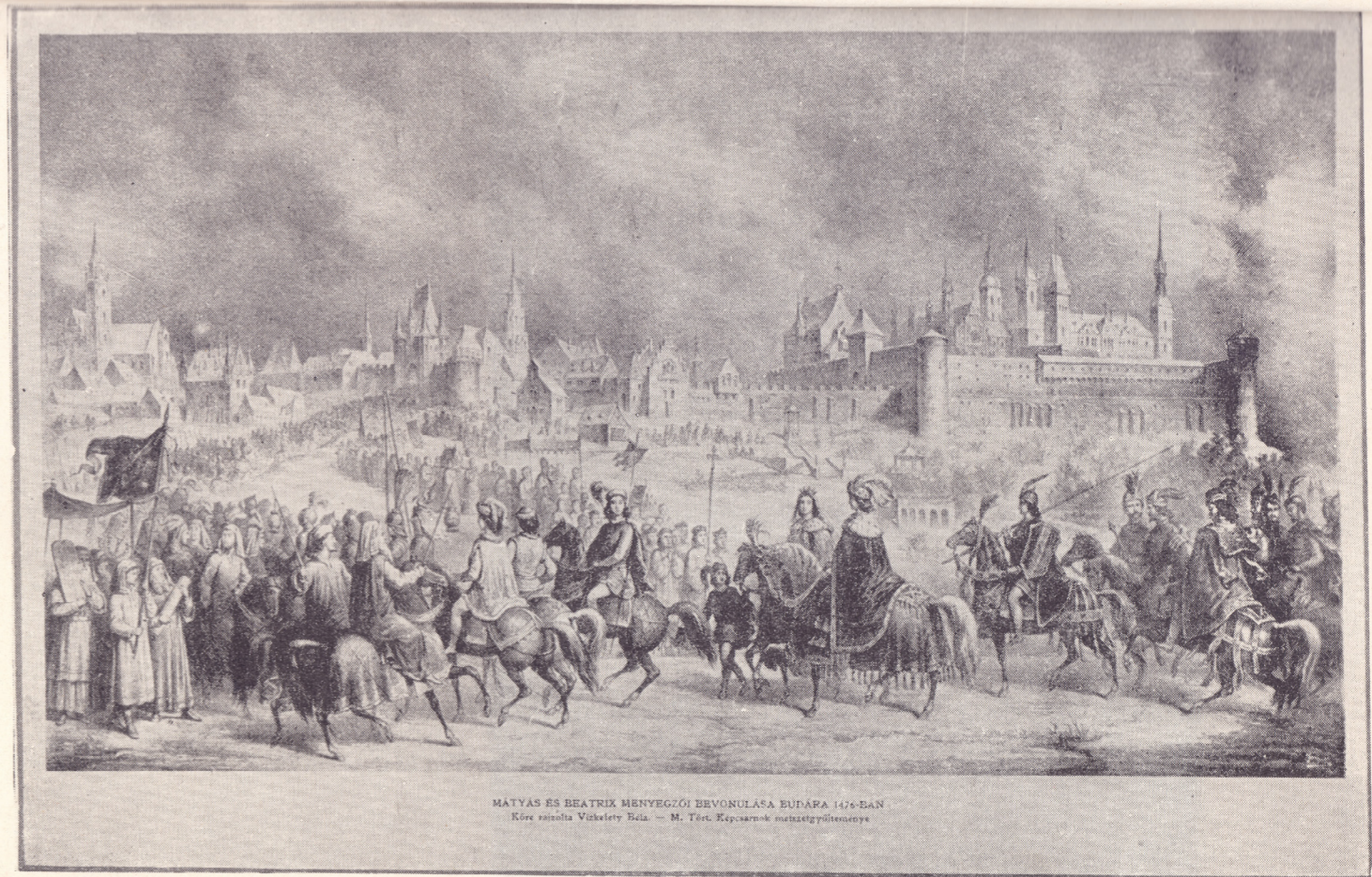
1476-ban a Mátyás királyt és menyasszonyát fogadó diszmenetben a budai zsidók lovas bandériummal vettek részt. Az élen a hitközség elnöke és ennek fia lovagolt kivont karddal (l. a kép baloldalán) Mögöttük 24 előkelő zsidó haladt ugyancsak jó háton, diszruhában, struccotlall a kalpagjaikon. Utánuk 200 zsidó lépkedett imaköpenyben biborszín zászló alatt. [Bongars Schwandiner-nél, Scriptorum rerum hungaric. II. 148]

Ítéltetek! című kiadvány illusztrációja: Beatrix fogadása (MILEV)