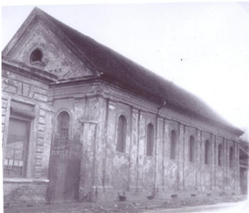
A szombathelyi zsinagóga utcai homlokzata az ötvenes években 31

polgároknak, ha sok helyen kegyetlenül üldöznek is, ha a mi templomunkat és szent tóratekercseinket gyalázatos módon megszentsegtelenítették és megrongálták, nem szabad szívünkben a gyűlöletnek és bosszúnak tért engedni. Sőt imádkoznunk kell jószágos Atyánkhoz, ezt a gaztettet ne torolja meg és ellenségeinknek bocsásson meg. 30