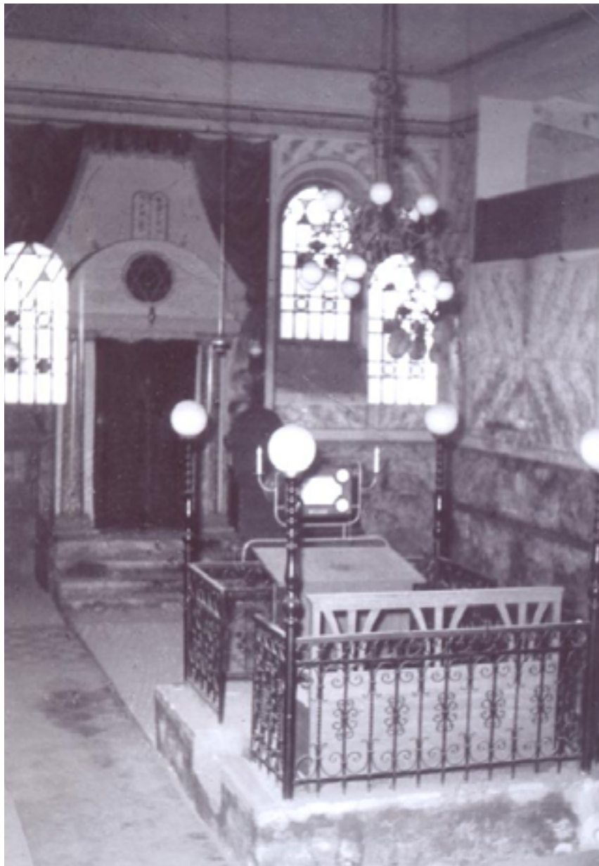
A Tóra-szekrény a bimával. 32 Jobbra fenn egy kis részlet látszik a női karzattól 33