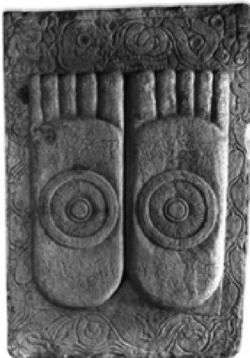
Buddha lábnyom. India, 2. század

természettudomány nem elégséges. Legyen bár helytálló az evolúcióelmélet, s legyen valóban atavisztikus örökségünk az emberi mimika alapjául szolgáló izomzat működésének genetikus programja, amelynek révén távoli őseink a maguk természetes közegében pozicionálták magukat a társas szituációkban, a kultúra olyan rétegeket épített erre az alapra, amelynek megértéséhez a kultúra felől kell közelítenünk.