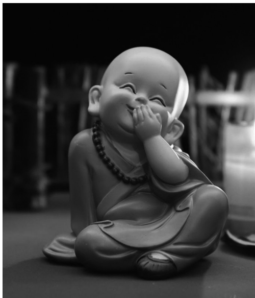
Kis szerzetes mosolyog

Gondoljunk elsőként arra a helyzetre, amikor valamit megértünk . Ilyenkor igen gyakran mondunk is valamit („tényleg!”), netán olyan kifejezést is használunk, amely egyértelműen indulati eleme a beszédnek (vagyis káromkodunk, s ez a jóféle, a pozitív lelkiállapotnak hangsúlyt adó káromkodás), sőt, még a kezünket is megmozdítjuk és fejünkhöz kapunk, de akár az egész testünkkel is reagálhatunk. Enyhébb formában azonban sokszor csak egy halvány mosoly jelenik meg az arcunkon, akkor is, ha egyedül vagyunk.