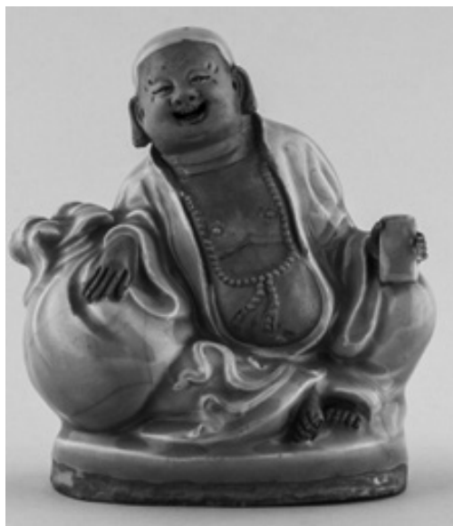
Hotei. Japán, 18. század

ri és miért ábrándulnak ki oly sokan, amikor olyan egyszerűsítő tanításokkal találkoznak, amelyek a szenvedés fogalma köré szerveződnek és ki is merülnek ebben, gyakorlatilag láthatatlanná téve a buddhizmus életörömet kifejező kultúráját.