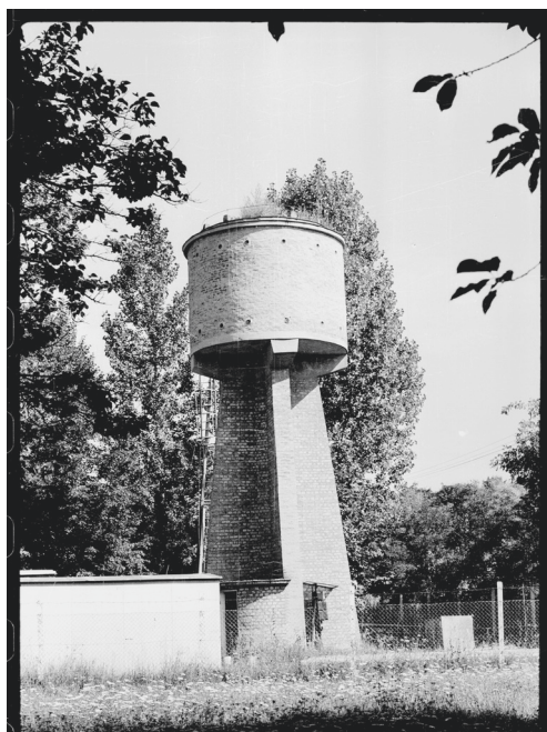
(Cserepespuszta, Gölle része, Somogy)