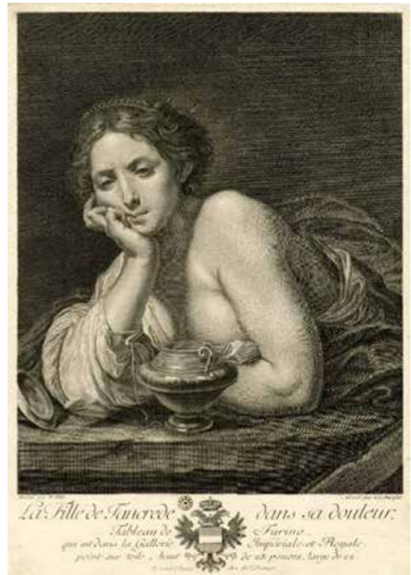
5. Johann Ernst Mansfeld – Wenzel Pohl: La fille de Tancrede dans sa douleur. Rézmetszet, 1760-as évek eleje?

Festménysorozat II. József német-római császárrá koronázásáról