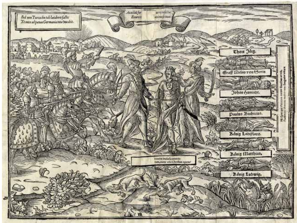
12. Johann Nel: Magyarország allegóriája. Fametszet, 1581

körülre datált rézmetszete is, 86 (11. kép) amelynek egy példánya a bécsi Képzőművészeti Akadémia Kupferstichkabinetjében található. 87 Mivel az 1800 előtti időszakra vonatkozóan nagyon ritkák a sokszorosított grafikai alkotások beszerzésére vonatkozó adatok, nem lehet tudni, hogy ez a lap már az