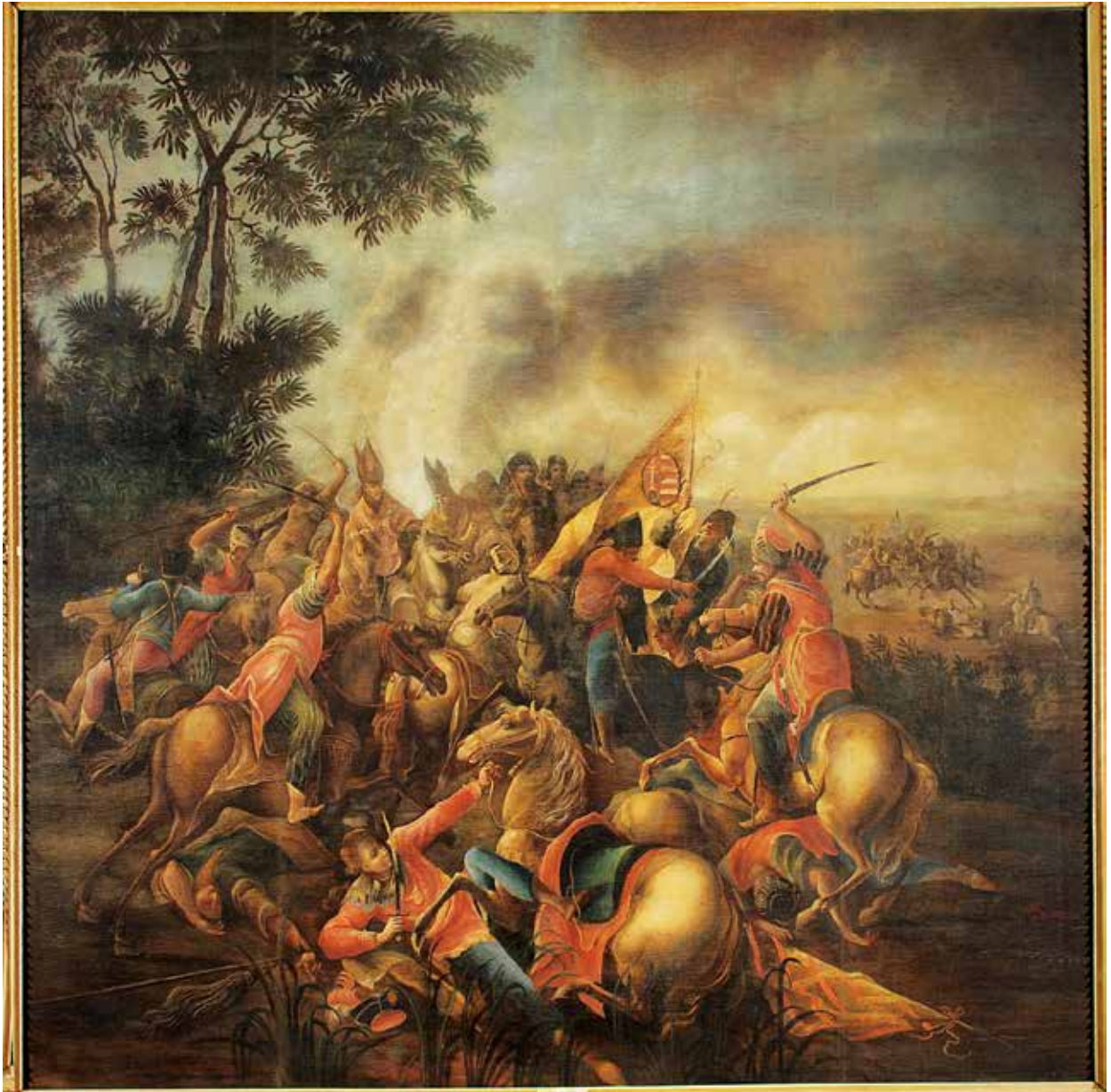
8. August Rumel (?): A mohácsi csata. Olaj, vászon, 1756–1758 körül. Bécs, Magyar Nagykövetség

rően nem ad áttekintő képet a hadiesemény egészéről, csupán annak egy mozzanatát mutatja be. Ezen az ábrázolásokon a festők – ahogy ez képünkön is megfigyelhető – gyakran törekednek arra, hogy a csatának egy konkrét, a történeti forrásokból ismert eseményét jelenítsék meg, vagy az ütközetben fontos szerepet játszó személyeket mutassanak be. Úgy tűnik, a mohácsi csata festője is figyelt arra, hogy képén ruházatuk vagy attribútumuk alapján azonosíthatóak legyenek a csata fontos magyar szereplői. A közelharcot ábrázoló központi jelenet bal oldalán infulát (mitra), azaz püspöksüveget viselő két lovas látható. Tudjuk, hogy a csatában hét főpap: a kalocsai és az esztergomi érsek, illetve öt püspök vesztette életét. 77 A hadrendben történt elhelyezke-