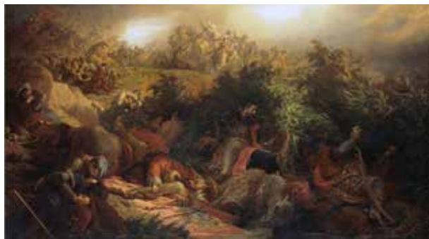
10. Székely Bertalan: A mohácsi csata. Olaj, vászon, 1862. Szépművészeti Múzeum – Magyar Nemzeti Galéria

met bemutató részének legismertebb másolata egy 1603-ban a feltételezések szerint Peter Paul Rubens (1577–1640) által készített, a Louvre-ban őrzött krétarajz, amely nem az eredeti műről, hanem annak rézmetszetes másolatáról készült. Lorenzo Zacchia (1524–1587) 1558-ból származó sokszorosított grafikája (37,4 × 47 cm) – amelynek egy példánya a bécsi Albertina grafikai gyűjteményében is megtalálható 85 – vagy az eredeti műről vagy Leonardo egyik vázlatáról készült. Népszerű volt Gérard Edelincknek (1640–1707) a kompozíciót bemutató, 1657–1666