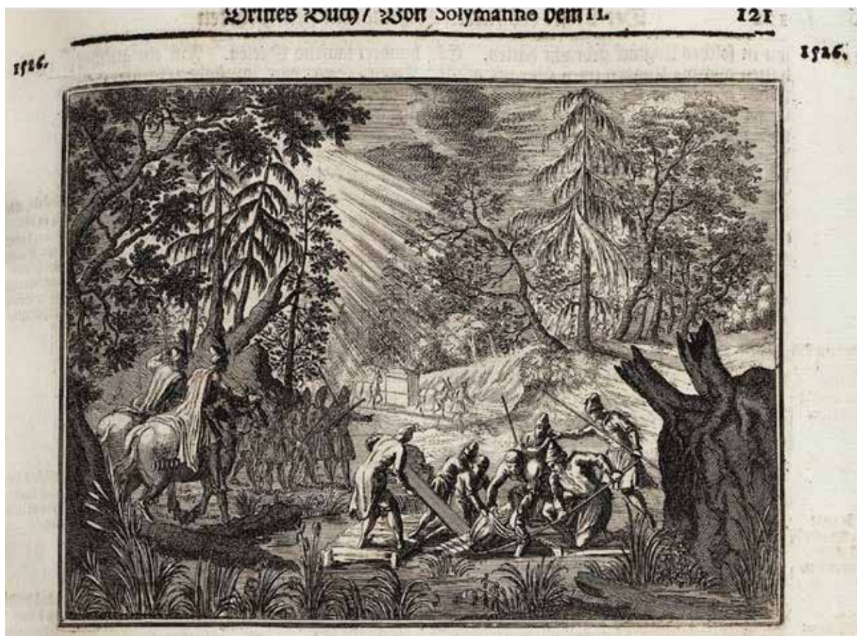
13. II. Lajos holttestének megtalálása. Rézmetszet. In: Paul Rycaut – Giovanni Sagredo: Die Neu-eröffnete Ottomanische Pforte . Augsburg 1694, 121.

A bécsi festményen a jelenet előtérben egy lováról földre zuhanó harcos, illetve egy feléje vágató lovas látható. Jókai Mór (1825–1904) a bécsi sorozatról 1895-ben megjelent ismertetésében 90 a központi jelenet lóról lezuhanó személyét egyértelműen II. Lajosként határozta meg: „A hatodik kép végre, mely a magyar miniszterné boudoirját díszíti, a mohácsi ütközet ábrázolása, melyben valódi genialitás nyilvánul, úgy az összes csoportozat megalakítása, mint az egyes alakok megfestése körül: az előtérben az ifjú II. Lajos király, a mint lovával együtt a Csele patakba hanyatlik.” 91 Ezzel a véleménnyel találkozunk a festmény egy lapos ismertetőjében is, amelynek forrása Lengyel László szakvéleménye volt: „A történeti hitelesség és azonosíthatóság megteremtéséhez a kompozíció közepén magyar címeres zászlót magasba emelő katonákat, Tomori Pál püspök hősi halálára utalva püspöksüveges főpapokat és középen lent a lováról leeső Lajos királyt ábrázolta festőnk.” 92 Ekként értelmezi a jelenetet Serfőző Szabolcs is: „Végül a hatodik – ma is meglévő