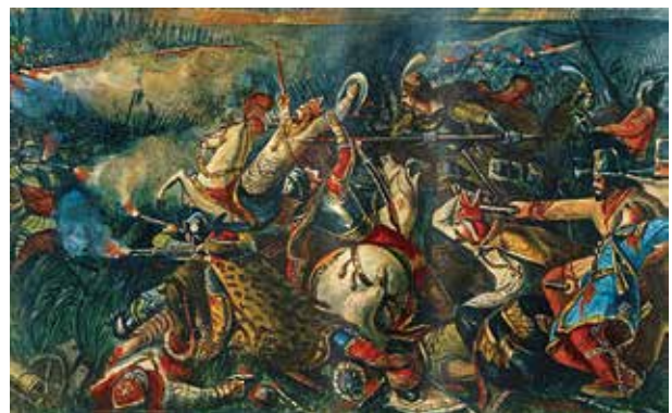
15. Than Mór: A mohácsi csata. Részlet. Olaj, vászon, 1846. Szépművészeti Múzeum – Magyar Nemzeti Galéria

a magyarok győzelmével kecsegtető szakaszát ábrázolta: a harcosok a kezében kivont karddal előrevágtató Tomori Pált követve rontanak az ellenségre. 101 Than festményén is találkozunk ugyanakkor a tragikus vég előrejelzésével: az előtérben a lováról hátraeső páncélos vitéz alakjában a festő talán II. Lajos halálát jelenítette meg. (15. kép) A témával foglalkozó későbbi képzőművészeti alkotások nagy