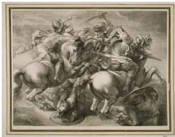
11. Gérard Edelinck: Az anghiari csata. Rézmetszet, 1657–1666 körül

met bemutató részének legismertebb másolata egy 1603-ban a feltételezések szerint Peter Paul Rubens (1577–1640) által készített, a Louvre-ban őrzött krétarajz, amely nem az eredeti műről, hanem annak rézmetszetes másolatáról készült. Lorenzo Zacchia (1524–1587) 1558-ból származó sokszorosított grafikája (37,4 × 47 cm) – amelynek egy példánya a bécsi Albertina grafikai gyűjteményében is megtalálható 85 – vagy az eredeti műről vagy Leonardo egyik vázlatáról készült. Népszerű volt Gérard Edelincknek (1640–1707) a kompozíciót bemutató, 1657–1666