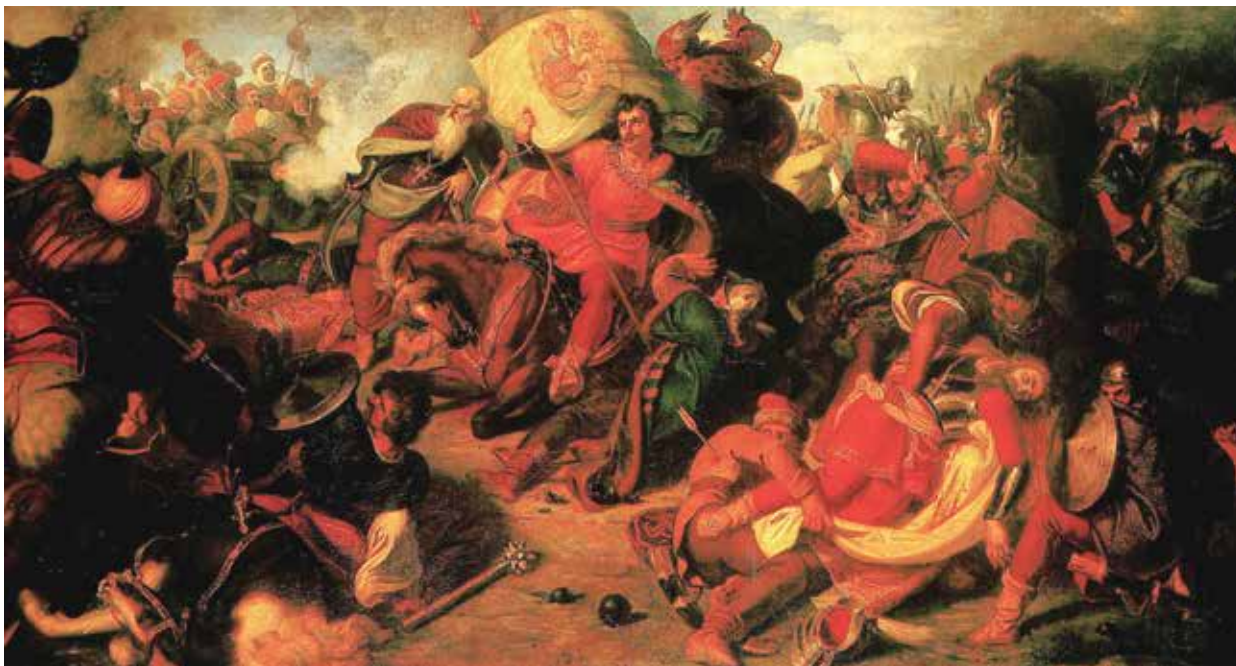
9. Than Mór: A mohácsi csata. Olaj, vászon, 1856. Kassa, Kelet-szlovákiai Múzeum (Východoslovenské múzeum)