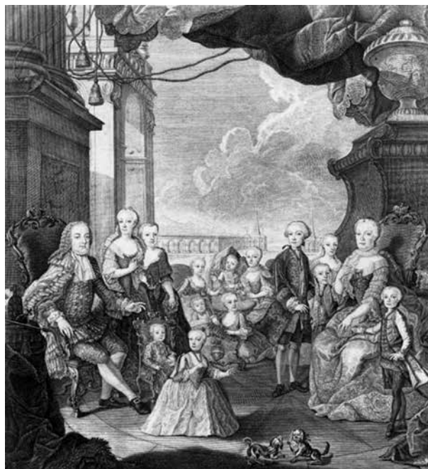
7. Johann Christoph Winkler: Mária Terézia és családja. Rézmetszet, 1756 körül