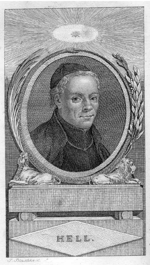
3. Johann Blaschke: Hell Miksa. Rézmetszet. In: Joseph von Hormayr: Oesterreichischer Plutarch . Band 9. Wien, 1807, 152–153. oldal között

Hell Miksának a Habsburg Birodalmon belüli megbecsültségét jelzi, hogy életrajza és portréja szerepelt Joseph von Hormayr (1782–1848) osztrák történész húsz kötetben kiadott, a birodalom történetének legfontosabb személyiségeit bemutató, Oesterreichischer Plutarch című életrajzgyűjteményének 1807-ben megjelent 9. kötetében (a 152–153. oldal között). (3. kép) Az életrajzhoz csatolt, Johann Blaschke (1770–1833) által készített portré 12 előképe Johann Esaias Nilson említett allegorikus metszetének Wenzel Pohl által rajzolt arcképe lehetett. Blaschke a beállítás (csak itt tükörfordítottan) és az arcvonások mellett az egyházi öltözetet és fejedőt is átvette, csupán egy vállra vetett köpennyel egészítette ki a kompozíciót. Blaschke portréi elkészítésekor – ahol lehetősége volt rá – törekedett a hitelességre, ezért tanulmányozta például az udvari könyvtár metszetgyűjteményét. Nilson sorozatának számos darabja, köztük több példányban Hell Miksáé – mint láttuk – megtalálható az Österreichische Nationalbibliothek Bildarchivjában, amely magában foglalja az egykori udvari könyvtár metszetgyűjteményének anyagát. Blaschke a majdnem negyven évvel ko-