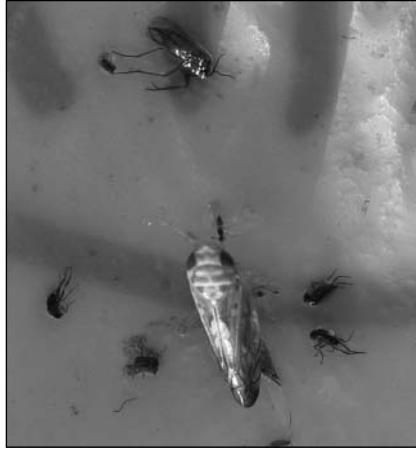
2. ábra Scaphoideus titanus Ball imágó zöldessárga ragadós csapdában (Nagyrada, 2010. 08. 17.)