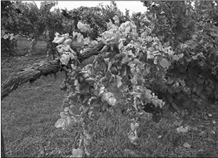
1. ábra A szőlő aranszínű sárgaság ( Flavescence dorée (FD) fitoplazma) tünetei szőlőtőkén

Napjainkban, Európában a Flavescence dorée fitoplazma a szőlő legsúlyosabb betegsége, mivel a termés hozam rendkívüli mértékben csökken és a tőkék gyors pusztulásnak indulnak (1. ábra).