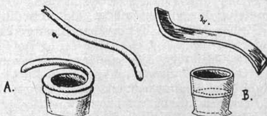
1. kép. Az agyagedény készítés egyszerű módjai a nagyoroszkoknál: A. agyagtekercesből, B. agyagszallagból (Moszynski után).

Mielőtt ezeknek az adatoknak a jelentőségével foglalkoznánk, lássuk, mit mond Mehedinți az „élő tűz“-gyújtás szokásáról. Erről lényegileg a következőket írja: Azon a területen, ahol az agyagtekerceskből készült edények ismeretesek, nevezetesen a Kelemen havasokban, virágzó juhtegyésztés folyik. Tavasszal, amikor a nyáját a havasi legelőkre hajtják, a pásztorok u. n. „élő tüzet“ gyújtanak két fadarab összedörzsölésével vagy pálcikák stgitségével, amelyekkel különböző módon fúró, sodró mozdulatokat végeznek egy keményebb fán. Mehedinți nem részletezi ugyan, de megemlíti, hogy az „élő tűznek“ tisztító, betegség, vészelhárító jelentősége van. Az így gyújtott tűz vagy annak füstje között keresztülhajtott nyáját veszedelem, baj nem éri. Az „élő tűz“ — mondja a szerző — az ősi hegyi juhászatnak a bizonyítéka. Azok a juhászok, akik a sztyeppeneken vándorolnak keresztül, nem rendelkeznek a tűzgyújtáshoz szükséges fával. A nomádok trágyával és fűvel gyújtanak tüzet. Az „élő tűz“ gyújtása éppen úgy, mint a fenti primitív fazekasság, a románok Erdélyben való letelepülésének régiségét bizonyítja.