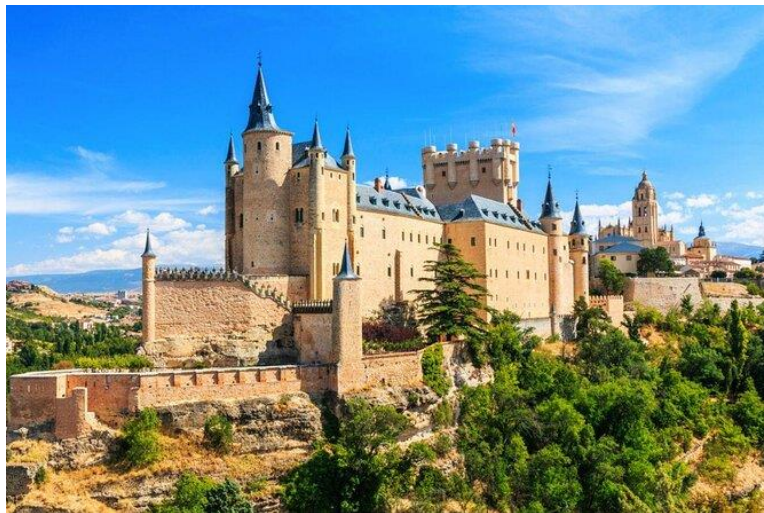
5. ábra: Alcazar de Segovia