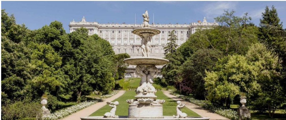
1. ábra: Palacio Real de Madrid – a Patrimonio Nacional tagja