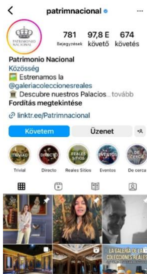
2. ábra: Patrimonio Nacional Instagram oldala