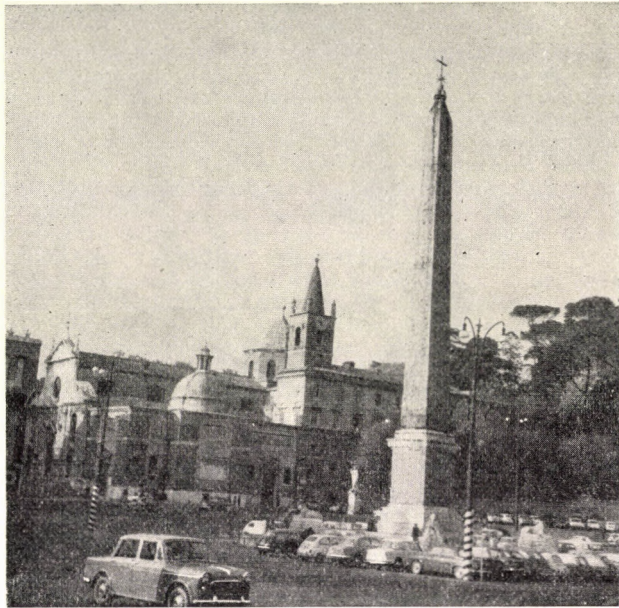
3. A Piazza del Popolo-i obeliszok