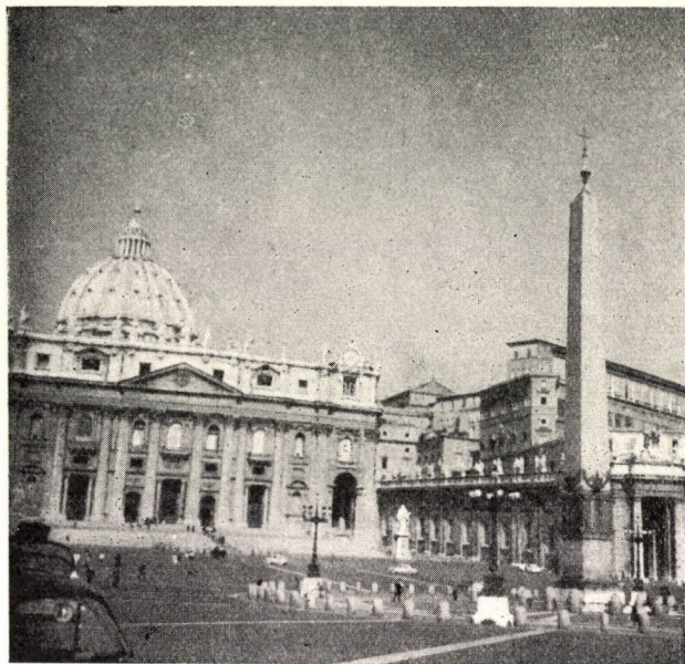
1. A Szent Péter téri obeliszk