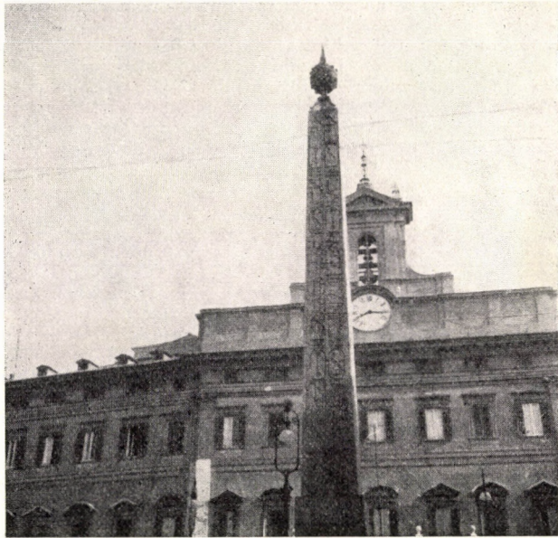
4. Obeliszok a Monte Citorio