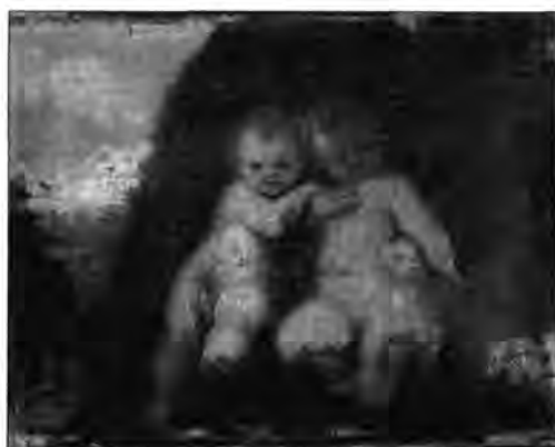
Olasz festő, XVII. század: A gyermek Jézus a kis Keresztelő Jánossal, lt. sz.: 882.

Az olasz – és különösen a velencei – mesterművek túlsúlya mellett természetesnek tűnik, hogy az Ausztriából származó gyűjteményben nagy szerep jutott a német mesterek alkotásainak is. Híres mesterek jelentős művei kerültek a gazdag császári képanyagból Pozsonyba és Budára. Első helyen említjük Albrecht Dürer sokat idézett, kicsiny méretű Férfiportróját . A képet a korai feljegyzésekben, például Lipót Vilmos 1659. évi inventárjában, majd a bécsi leltárakban (Storffernél az 1733. és 1772. évi inventárban) Hans Holbein alkotásaként idézték, s csak a XIX. század során, a régi német mesterek alaposabb feldolgozása nyomán hozták kapcsolatba Dürerrel. A számtalan nemzetközi kiállításon bemutatott remekmű mestere, továbbá az ábrázolt alak kiléte körül azonban még ma is eltérő vélemények ütköznek. A kifejezés ereje és a kidolgozás puritán egyszerűsége a szakértők nagy része szerint Dürer szerzőségét valószínűsíti. Egyes szakértők a Dürer-tanítvány, Hans Suss von Kulmbachhoz hozzák kapcsolatba, mások a kortárs Hans Baldung Grien művének gondolják. Eltérnek a nézetek az ábrázolt személy kilétét illetően is, sokáig Dürer öccsét,