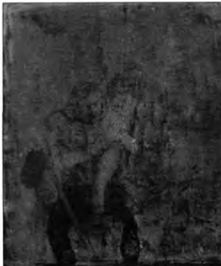
Adriaen Brouwer után: Borbélyműhely, lt. sz.: 3153.