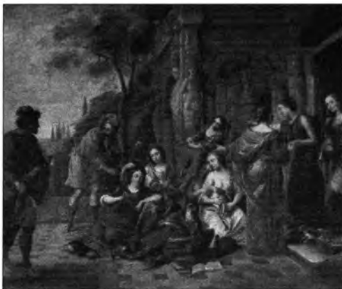
Erasmus Quellinus: Achilles Lykomedes leányaival, lt. sz.: 71.22.