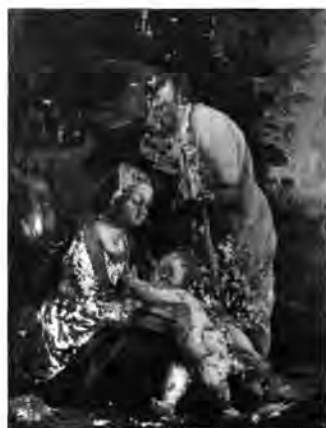
Északolasz festő, XVI. század: Pihenő Szent Család, lt. sz.: 805.

A velencei és északolasz festészet idézett gazdag forrására vezethető vissza gyűjteménycsoportunk még számos további darabja, például az eddig figyelmen kívül hagyott, azonosítatlan bresciai Szent Jeromos -ábrázolás, melyet Bartolomeo della Navénál 1638-ban Romanino Bressiano (Girolamo Romanino) művei közt tartottak számon. A kép bresciai eredete aligha vitatható, de mesterének pontos meghatározása még további vizsgálatot igényel. 23 Romanino műveként szerepelt ugyanott az a félalakos Madonna-kép is, amelyen a gyermekét imádó Mária mellett Toulouse-i Szent Lajos félalakja látható. Lipót Vilmos főherceg képtárában ( Theatrum Pictorium ) Tiziano, illetve Polidoro (Lanzano; Inv. 1659.) nevét viselte, az újabb kritika a Tizianoéhoz közel álló velencei mester, Polidoro Lanzano (da Lanciano) jellegzetes alkotásának tekinti. Ugyancsak Polidoro Lanzano műveként reprodukálták