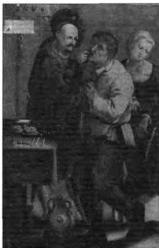
Lucas van Leyden után: Foghúzás, lt. sz.: 51.774.