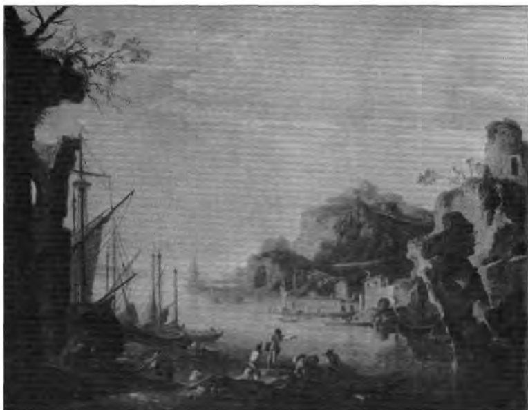
4.2.2. Salvator Rosa: Táj kikötővel, lt. sz.: 535.

Mint az eddigiekből is kitűnik, a taglalt gyűjtemény zömét és legértékesebb részét a XVI. századi velenicei, észak-itáliai munkák alkották. A későbbi mesterek alkotásai közül említést érdemel Domenico Fetti Fiatel szent szerzetes mellképe, mely Lipót Vilmos galériájában „Original von Fetti di Mantoa” megjelöléssel