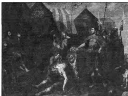
4.2.12. Peter van Lint: Mucius Scaevola Porsenna előtt, lt. sz.: 971.