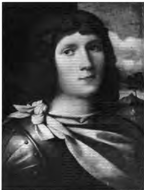
Jacopo Palma Vecchio: Koszorús fejű ifjú képmása, lt. sz.: 3460.