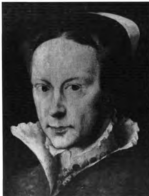
Anthony van Mor után: I. Mária angol királynő, lt. sz.: 375.

nyol király és I. Mária angol királynő portréjával, egy szegfűt tartó hölgyről festett félalakos Női képmás , valamint egy rendkívül kvalitásos Férfi mellkép (lt. sz.: 883.). Mindezekkel a bécsi császári gyűjtemény különböző leltáraiban, a Storffer-kötetekben és a Prodromus ban is találkozunk. Ugyanezt az eredetet mutatathatjuk ki annál a két finom tájképnél, melyet a múltban Jan Brueghellel, újabban Abraham Govaerts-szel hoztak kapcsolatba, továbbá a Diana és Acteon mondáját megjelenítő kis jelenet, a flamand Bernaert de Ryckere ritka jelzett műve esetében. 38