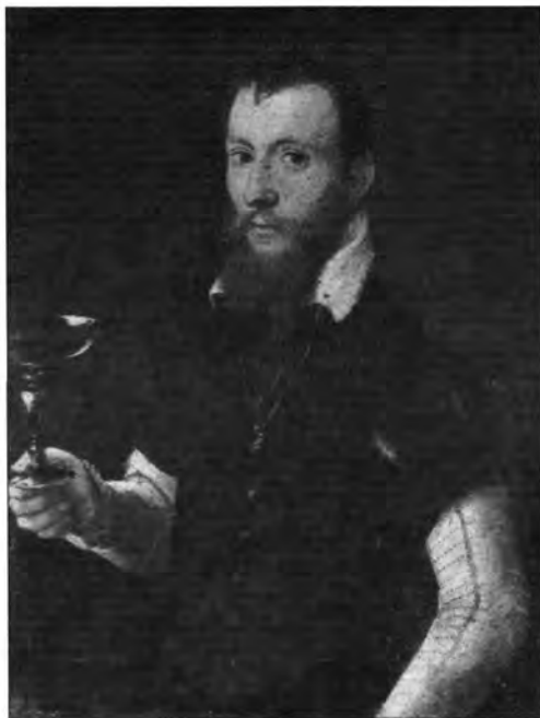
4.2.6. Jacob Seisenegger: Férfiképmás, lt. sz.: 437.

nyomán készült másolatot említhetünk. A jeles német mester több változatban is fennmaradt, Hendrik Goudt által metszeten megörökített népszerű kompozícióját – mint az a hátoldalán lévő feliratból kitűnik – Theodor Caspar von Fürstenberg festette 1654-ben III. Ferdinánd császárnak. 35 A festéssel és grafikával foglalkozó egyházi férfiúnak annak idején több műve került a bécsi gyűjteményekbe, minthogy azonban ezek a képek nem maradtak fenn, a budapesti festmény az Ovidius Metamorphoses éből vett ábrázolással ( Abas kigúnyolja Cerest ) különös jelentőséggel bír.