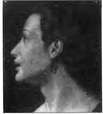
Olasz (firenzei?) festő, XVI. század: Női mellkép , lt. sz.: 809.

portrét, amely egykor Tiziano műveként szerepelt, s amely néhány további hasonló méretű és beállítású, azonos eredetű mellképpel együtt feltehetően egy híres embereket (művészeket?) ábrázoló arcképsorozat-hoz tartozhatott. 26 Ide sorolhatjuk a Szépművészeti Múzeum gyűjteményéből Tintoretto Férfiképmását és Őnarckép-változatát , két északolasz Férfiképmást , valamint több ilyen mellképet is a bécsi képtárban.