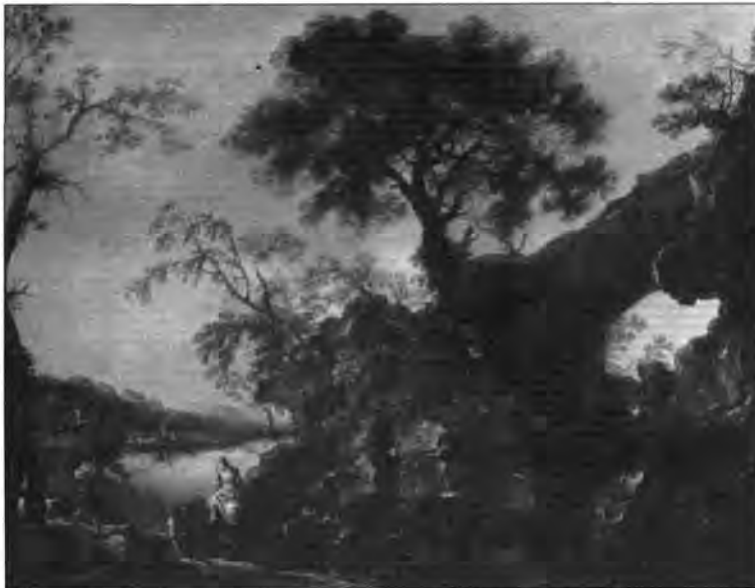
4.2.1. Salvator Rosa: Táj vízeséssel , lt. sz.: 529.

Lotto gondosan vezetett számadáskönyveiből részletesen ismerjük a feltehetően 1545–1549-ben készült festmény viszontagságait, a festő próbálkozásait, hogy előbb Anconában, majd Rómában vevőt találjon rá. A képnek 1553-ban – a mesterhez Loretóba visszakerülve – nyoma vész, s csak 1646-ban találkozunk vele ismét Angliában, a Hamilton márki által Velencéből vett festmények közt, ezt követően pedig Lipót Vilmos főherceg brüsszeli és bécsi képtárában. Mint az a régi leírásokból (1646, 1659) kiténik, a kompozíció ekkor még teljes volt a gazdag tájképi környezetben alvó Apollóval, a tovaszálló Hírénvvel (Famával), s mindkét oldalon a szétszéledő múzsákkal. Ferdinand Storffer festett inventárjában (1720) és a bécsi Stallburg képeit