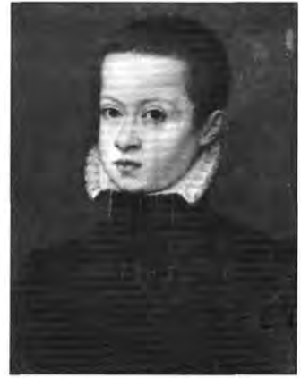
Délnémetalföldi festő, XVI. század: Ifjú képmása, lt. sz.: 368.