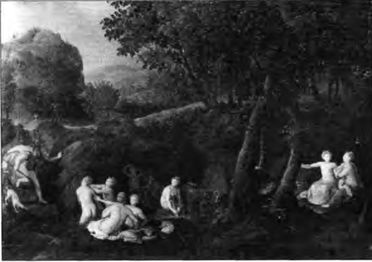
4.2.15. Bernaert de Ryckere: Diana szarvassá változtatja Actaeont, lt. sz.: 378.

készült Foghúzás vagy Artemisia Gentileschi 1620-ból jelzett remekműve, a Jáhel és Sisera ; mindezek a K. K. gyűjtőjel található. 41 Ide sorolható egy közelebről még meg nem határozott kép, amely a február hónapot ábrázolja Farsangi jelenettel , s része egy hónapokat bemutató sorozatnak, melynek további darabjai Budapesten és Bécsben található. 42 Az Andries Danielsznek – korábban Ambrosius Boschaertnak – tulajdonított Virágok vázában csendéleten a megfelelő bécsi leltári szám (600.) látható. A kiváló német csendéletfestő, Georg Flegel újabban megszerzett festménytöredéke, a Csendélet sajttal és edénnyel – másik darabja cseh gyűjteménybe került – a bécsi leltárakban és Lipót Vilmos galériájában mutatható ki. 43 Ugyancsak új szerzemény a Franz Geffels-kép, az Itáliai táj romokkal , amely több budavári eredetű festménnyel együtt Kilényi Hugó budapesti gyűjteményében volt és az 1781. évi pozsonyi képjegyzékben említett művek közt szerepelt. 44