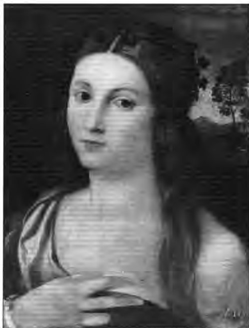
Jacopo Palma Vecchio: Koszorús leányfej, lt. sz.: 939.

állapotára. Sok esetben az adott keretekhez alkalmazkodva megkurtították, körülvágták vagy éppen kiegészítették a festményeket, megfelelő restaurálásra hosszú időn át nemigen került sor, a régi sérülések, átfestések gyakran megnehezítették a helyes értékelést. Csak hosszabb idő és kutatómunka nyomán sikerült a művek valódi jelentőségét és helyét felmérni az egyetemes művészet keretében. 19 Így kerülhetett az érdeklődés előterébe mindenekelőtt az olasz reneszánsz festészet néhány remeke, amely egykor még Lipót Vilmos főherceg képtárában szerzett hírnevet.