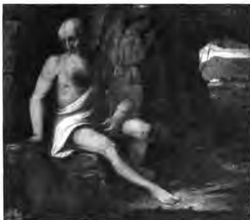
Bresciai festő, XVI. század: Szent Jeromos, lt. sz.: 2691.