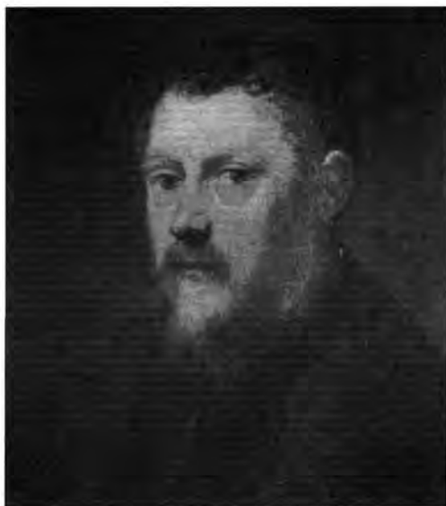
4.2.16. Tintoretto: Férfiképmás , lt. sz.: 114.

Lipót Vilmos képtárának metszetkiadványában azt a súlyosan rongált Pihenő Szent Család -ábrázolást, melyet ma már csak általánosan „északolasz” alkotásként tudunk megnevezni (hátoldalán mindmáig látható a főhercegi képtár K. K. gyűjtőjele és 1659. évi leltári száma: 311.). 24