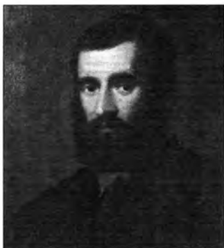
Velencei festő (Tiziano?), XVI. század: Férfiképmás, lt. sz.: 983.