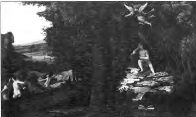
4.2.14. Lorenzo Lotto: Apolló és a múzsák , It. sz.: 947.

Ezekkel a bonyolult előzményekkel kell számot vetnünk, amikor a Szépművészeti Múzeumban őrzött budai képanyag közelebbi bemutatására vállalkozunk. Szembesülnünk kell azzal a ténnyel is, hogy a történelmi viszontagságok, a sok szállítás, a rossz elhelyezés óhatatlanul rányomta bélyegét a művek állagára,