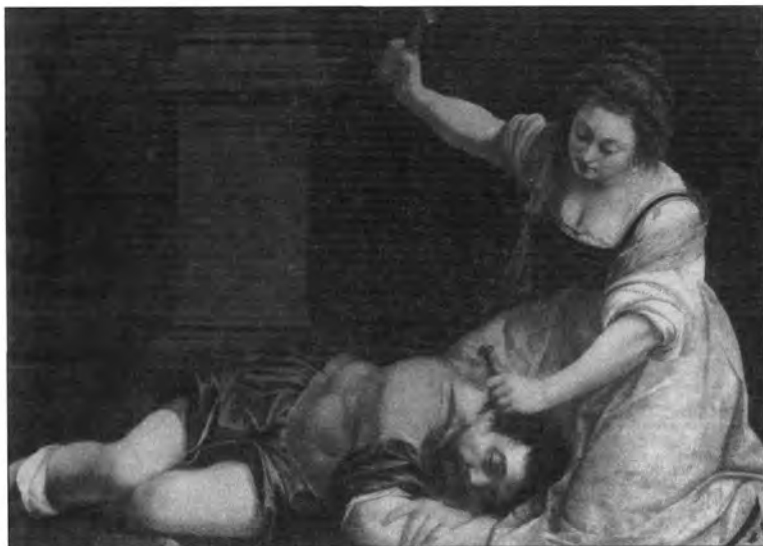
4.2.3. Artemisia Gentileschi: Jáhel és Sisera, lt. sz.: 75.11.