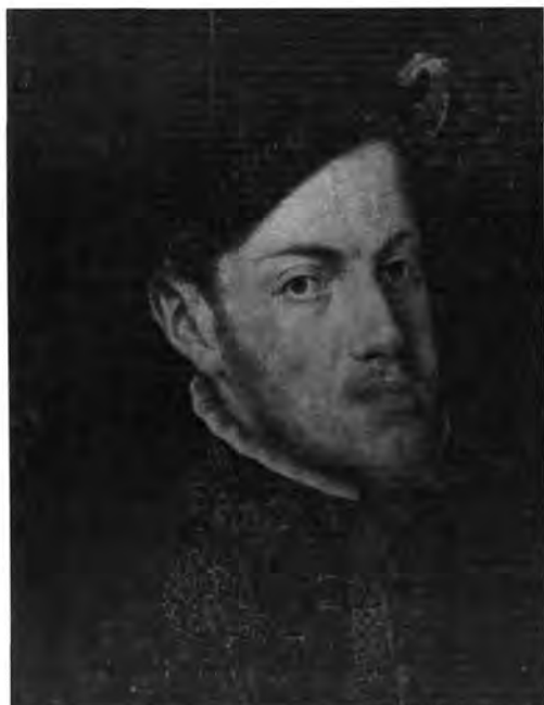
Anthony van Mor után: II. Fülöp spanyol király, lt. sz.: 374.