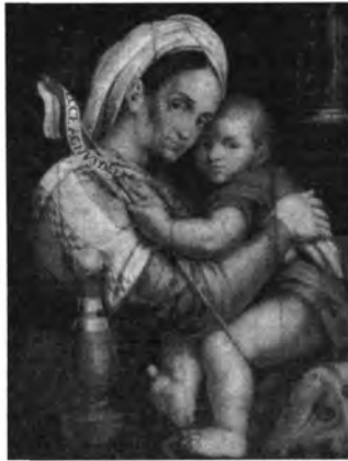
Raffaello után: Mária gyermekével, lt. sz.: 980.