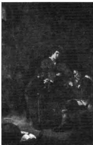
Jacob Toorenvliet: Falusi zenészek, lt. sz.: 331.