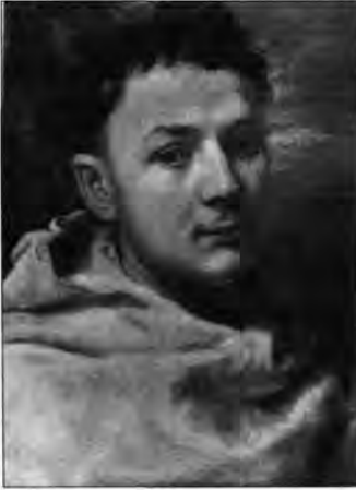
Domenico Fetti: Fiatal szent szerzetes , lt. sz.: 580.