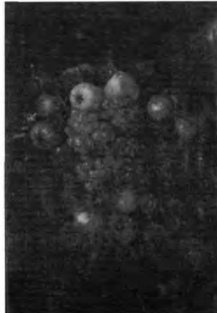
Gertrude Metz: Gyümölcscsendélet, lt. sz.: 1055.