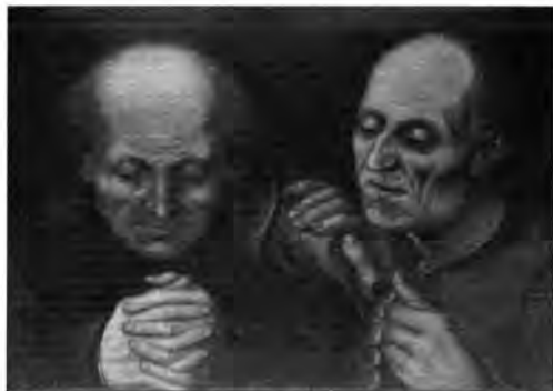
Délnémetalföldi festő, XVI. század: Két imádkozó őreg, lt. sz.: 877.