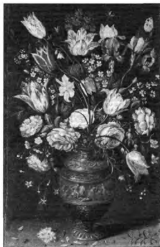
Andries Danielsz (A. Boschaert?): Virágok vázában, lt. sz.: 65.27.