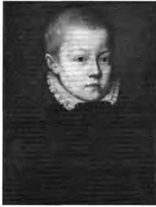
Délnémetalföldi festő, XVI. század: Ifjú képmása, lt. sz.: 367.