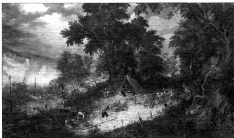
4.2.8. Abraham Govaerts: Tájkép halászsokkal , lt. sz.: 377.

A XVII. század nagy flamand mesterei közül csak Rubens szerepel a képegyüttesben, a több változatban ismert Tivornyázó katonákkal . A bécsi Stallburgban már 1720-ban szereplő festmény (lásd Storffer I. kötetében és a Prodromus ban) eredetileg 1640-ben, Antwerpenben Rubens hagyatékában volt, a források szerint