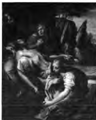
Bolognai festő, XVII. század: Krisztus siratása, lt. sz.: 951.