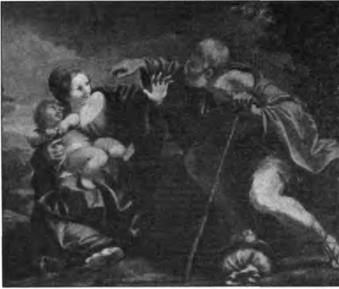
Olasz festő, XVII. század: Szent Család, lt. sz.: 977.