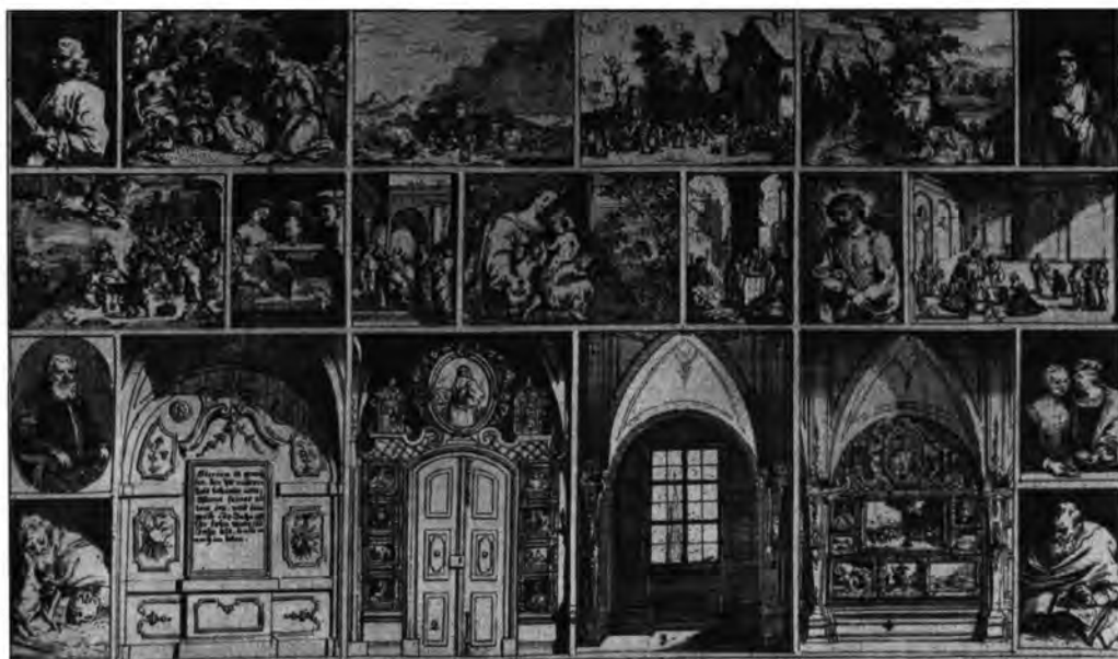
A Prodomus-metszetkiadvány egy lapja.