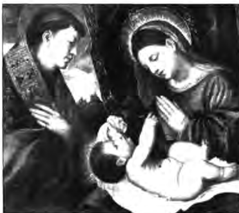
Poldoro di Lanzano (da Lanciano): Mária Jézussal és Toulouse-i Szent Lajossal, lt. sz.: 113.

alapján menyasszonyi portréként értelmezi a kritika. Két fennmaradt, gyengébb minőségű változata – a modenai Galleria Estensében és amerikai gyűjteményben fennmaradt – az ábrázolás egykori népszerűségéről tanúskodik, s a XVII. századi metszetreprodukcióhoz hasonlóan arról a körülményről is, hogy eredetileg nagyobb méretű (csaknem félalak) volt, ám az idők során az alsó képrészt levágták. Az újabban letisztított, jelentős nemzetközi kiállításokon is szereplő festmény alkotóját a szakértők zöme a Giorgionéhoz közel álló velencei Giovanni Carianiban véli felismerni. 21