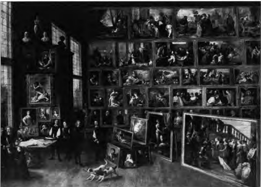
David Teniers: Lipót Vilmos brüsszeli galériájának látkepe. Bécs, Kunsthistorisches Museum, Madrid, Prado.

A magyar műkincsállomány és a műalkotások fennmaradása szempontjából ez az intézkedés különösen fontos volt. Minthogy a budai palota képgyűjteménye szétszóródott, elkallódott, részben talán megsemmisült, a Budára került műkincsekről összefüggő tételben, nagyobb együttesben csak az a képanyag adhat fogalmat, amelyet a kamaraelnöki lakásból a Nemzeti Múzeumnak adtak át, s amelyet azután a Szépművészeti Múzeum megőrzött. A képek történetét messzire követhetjük visszafelé az időben, számos dokumentum és adat áll rendelkezésünkre, hogy mestereiket, megrendelőiket, korábbi tulajdonosaikat meghatározzuk. A