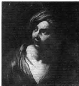
Olasz festő, XVII. század: Nő turbánnal, lt. sz.: 968.