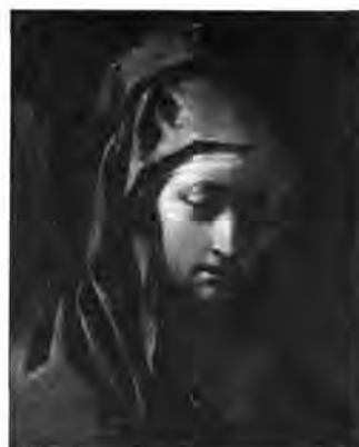
Francesco Cairo: Mária feje, lt. sz.: 815.

A két Salvator Rosa-tájképpel együtt kerülhetett az ambrasi kastélyból Bécsbe, azután Pozsonyba és Budára a XVII. századi olasz festészet egy további értékes alkotása, a veronai Alessandro Turchi (L'Orbetto) képe, A sebesült Tankréd Erminiával és Vafrinóval . A Torquato Tasso-hősköltemény, a Fel-szabadított Jeruzsálem egyik jelenetét megelevenítő kép (a párharcban megsérült Tankréd vérző sebét a szerelmes Erminia levágott hajával próbálja elkötni) eredetileg egy másik regényes ábrázolással, egy ovidiusi jelenettel együtt szerepelt az 1663. évi ambrasi leltárban. Ez utóbbi festménynek azonban nyoma veszett, csak az eredeti bécsi számmal megjelölt Tankréd és Erminiát sikerült a budai gyűjteményből azonosítani. 31