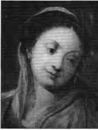
Correggio után: Mária, lt. sz.: 1004.