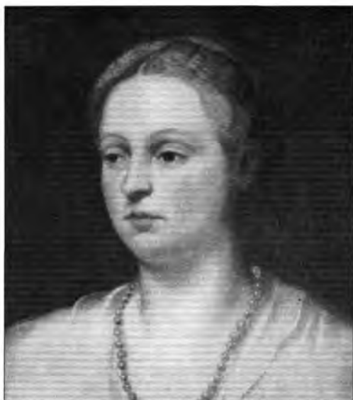
4.2.17. Tintoretto: Női képmás , lt. sz.: 112.