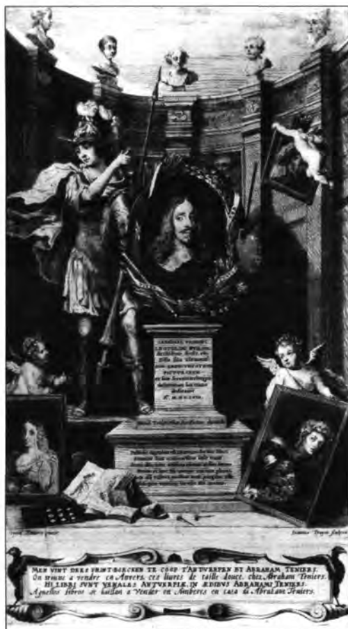
David Teniers: A Theatrum Pictorum cimlapja. Bécs, Kunsthistorisches Museum.