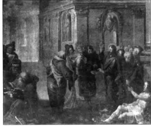
Tobias Pock: Adógaras, lt. sz.: 3155.