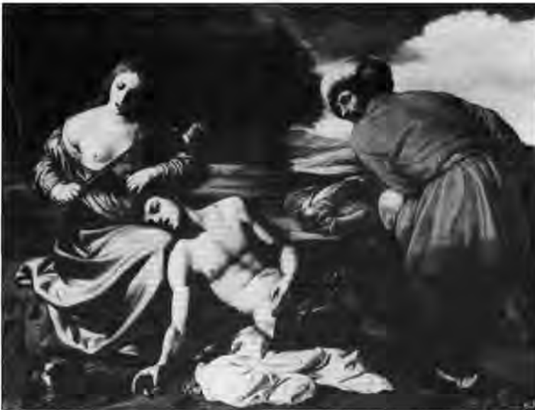
4.2.4. Alessandro Turchi: Tankréd és Erminia , lt. sz.: 477.