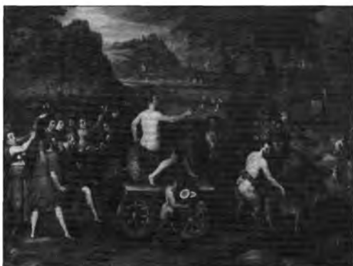
4.2.11. Antonio Vassilacchi: Bacchus diadalmenete, lt. sz.: 972.