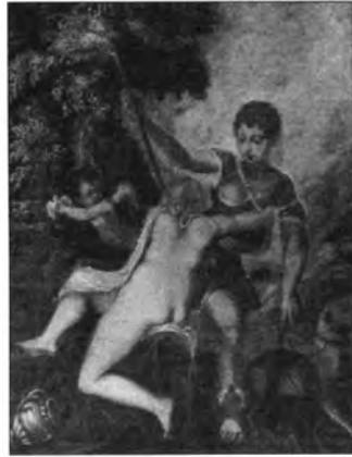
Andrea Schiavone: Vénusz és Adonisz, lt. sz.: 3154.