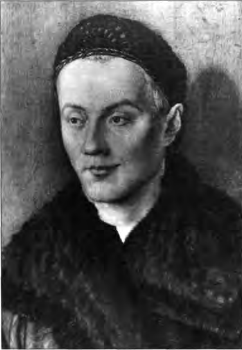
Albrecht Dürer: Férfiportré, lt. sz.: 142.