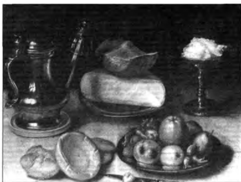
Floris van Dyck: Csendélet sajittal, lt. sz.: 327.