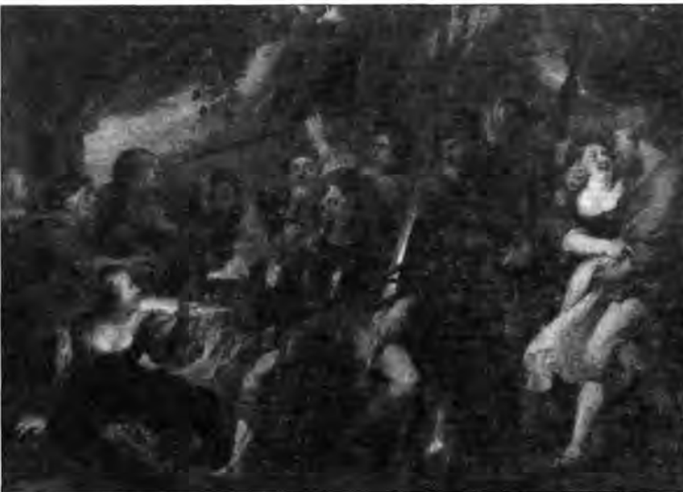
4.2.10. Pieter Pauwels Rubens: Tivornyázó katonák, lt. sz.: 970.

A budai árverésen szétszóródott, a palotából elkallódott képekből még jó néhányat nyomon követhetünk budapesti gyűjteményekben, egy részük azonban az idők során sajnos külföldre vándorolt, másoknak nyoma veszett. A kölni Wallraf-Richartz Múzeum őrzi az egykor Kilényi Hugó gyűjteményéből közzétett,