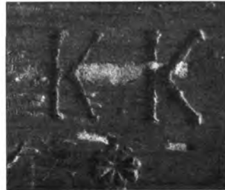
K. K. gyűjtőjel budavári képen.