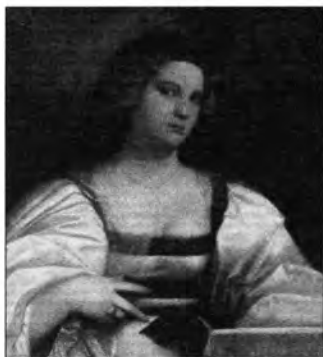
Velencei festő (G. Cariani), XVI. század: Fial nő képmása, „Violante”, lt. sz.: 84.