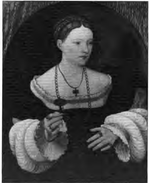
Németalföldi festő, XVI. század: Női képmás, lt. sz.: 354.

A kamaraelnöki lakásból a Nemzeti Múzeumnak átadott 78 festményből álló gyűjtemény zömét és legjavát bemutató elemzésünk kiegészítéseként szót kell még ejtenünk azokról a további alkotásokról, amelyek az idők során más úton jutottak a Szépművészeti Múzeumba, de végső soron a budavári képanyagból származnak. Azonosításukat, meghatározásukat a fentiekben már említett jelek – a budai árverés beégetett K. K. (azaz Kaiserlich Königlich) gyűjtőjele és sorszáma, az 1772. évi bécsi inventár fehérrel festett leltári száma vagy valamely korabeli dokumentum leírása – tették lehetővé. Budapesti árveréseken vagy magángyűjteményekben bukkantak fel, mint a már idézett, Palma Vecchiótól származó Koszorús fejű ifjú képmása , a Lucas van Leyden metszete nyomán