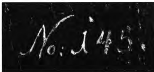
A császári gyűjtemény leltári száma budapesti képen.