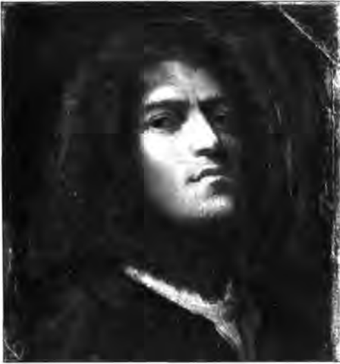
Giorgione (?): Őnarckép , It. sz.: 86.

ből származik a Szépművészeti Múzeum több nevezetes alkotása, a Giorgionének tulajdonított kis Őnarckép , a Jegyespár , azaz a Koszorús fejű ifjú és leány képmása Palma Vecchiótól, Cariani Fiatal nő képmása , valamint az Apolló és a múzsák festmény Lorenzo Lottótól stb.