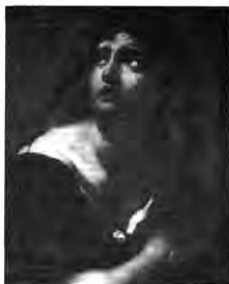
Bolognai festő, XVII. század: Bűnbánó Magdolna, lt. sz.: 967.