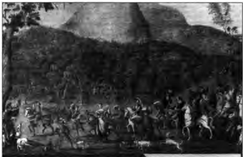
Délnémetalföldi festő, XVI. század: Sólyomvadászat, lt. sz.: 1018.

A budavári anyagból származó németalföldi festmények között több érdekes és jellemző, de mesternevhez nehezen köthető alkotást találunk. A Quentin Massyst követő brügge-i Szent Vér Egyesület oltárának mesterétől származó Lucretia -ábrázolás egy, a XVI. század elején népszerű képtípus kvalitásos változata, s ugyancsak Massys körébe utalható az a Két imádkozó őreget ábrázoló félalakos festmény, melynek számos variánsa maradt fenn a különböző európai gyűjteményekben (Róma, Galleria Doria, Sibiu, Brukenthal Museum stb.). 36 Lucas van Leyden körébe utalhatjuk a bécsi Schatzkammerből származó Kártyázókat , ugyanott szerepelt egykor