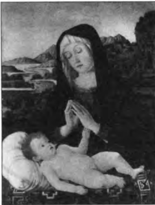
Jacopo da Valenza (G. Bellini után): Mária gyermekével, lt. sz.: 73.