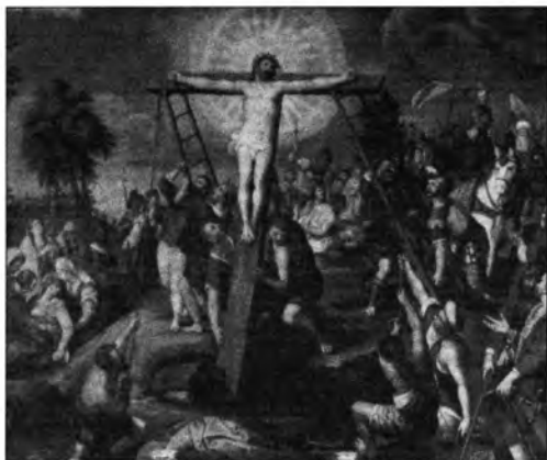
Christoph Schwarz után: A keresztfelállítás, lt. sz.: 869.