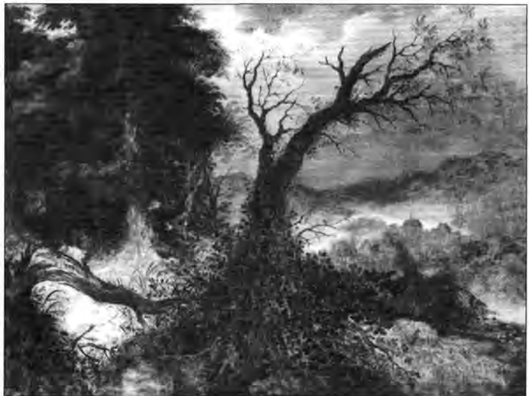
4.2.9. Abraham Govaerts: Sziklás táj folyóval , lt. sz.: 379.