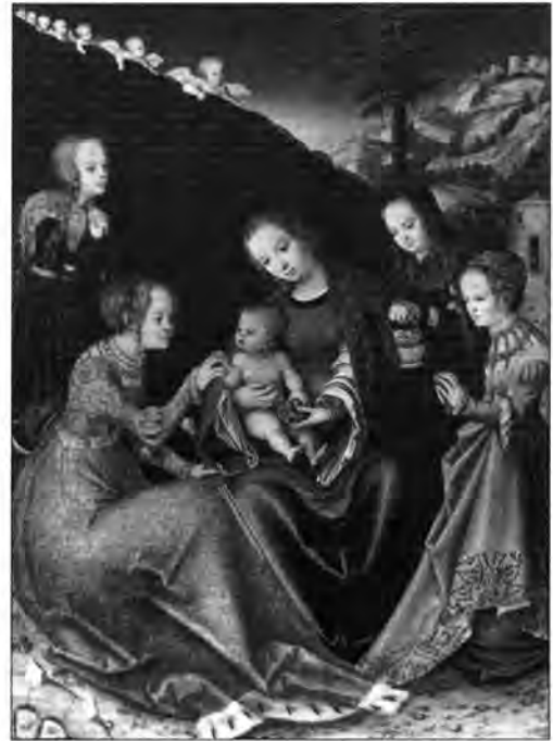
Lucas Cranach: Alexandriai Szent Katalin eljegyzése , lt. sz.: 133.