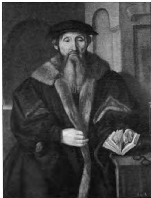
4.2.5. Georg Pencz: Tudós képmása, lt. sz.: 912.