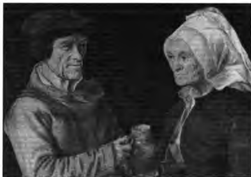
Pieter Bruegel követője, XVI. század második fele: Idős házaspár, lt. sz.: 559.