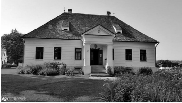
A Damokos kúria az alapkiállítás színhelye