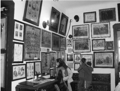
Az Alapkiállítás egyik részlete