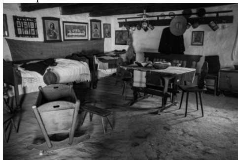
Az alapkiállítás részlete