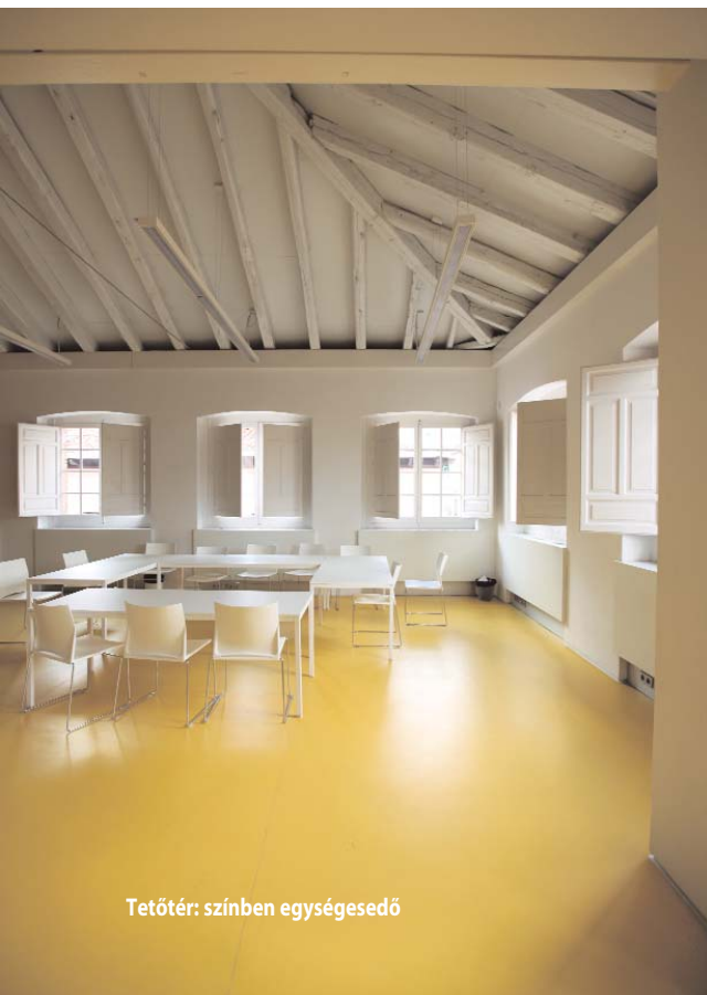
Tetőtér: színben egységesedő

lis és vertikális együttes alkalmazása. A trianguláris panelek rajzolata formailag lazán kötődik a kapuzattómb vonalrajzához – a szabad kompozícióban pedig könnyen elrejtőzhetnek a megnyitások. Az átrium padozata az alatta húzódó, új, kétszintes kiállítótér felülvilágítóit rejt, a homlokzati felületen pedig a régi épületszárny déli traktusába pozicionált közlekedő és kiegészítő funkcióknak ad szűrőfényt a megnyitások által. Esti-éjszakai feltárlásában e két burkolati réteg a kiszűrődő led-fényekkel képzőművészeti vernissázsok díszes udvarává varázsolja a kis szabadtéri területet.