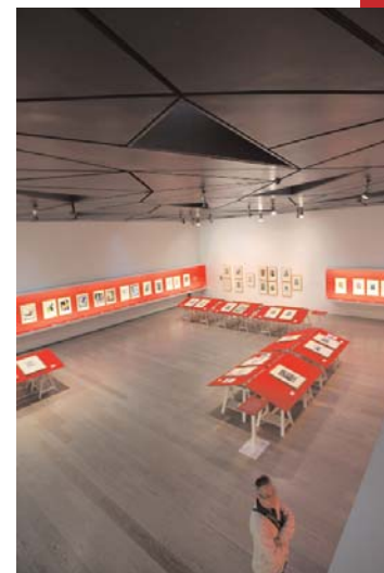
Pincészet: az átrium alatti nagy kiállítótér

A cikk az MTA Bolyai János Kutatási Ösztöndíj támogatásával valósult meg.