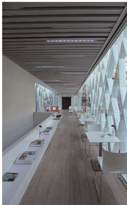
Könnyed acélszerkezet: japánosan minden fehér