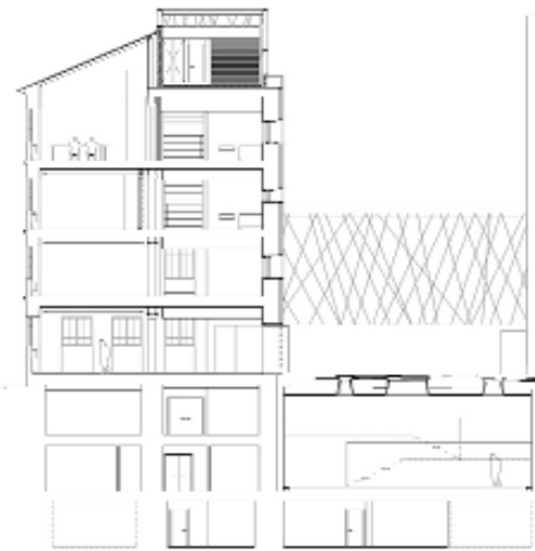
Metszet: a régi épület és az udvar alatti kiállítótér