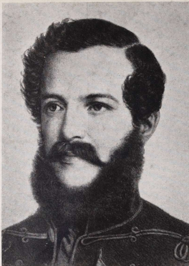
Szemere Bertalan (Barabás Miklós litográfiája)