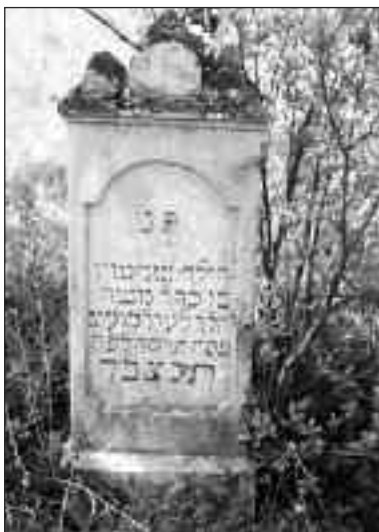
1. kép. A másik Kalotaszeg. Zsidó sírkő – Gyergyóvásárhely

„Helynévi és földtani érvek tisztázatlan középkori bányászattörténeti adatok pontosításához Kalotaszegen,” In: Szónokyné Ancsin Gabriella (szerk.): Magyarok a Kárpát-medencében , 2. Egyesület Közép-Európa Kutatására, 105-121. Szeged