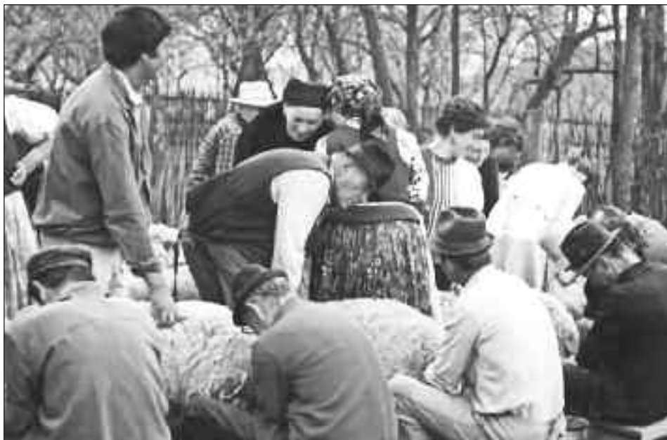
4. kép. Az egyik utolsó tejbemérés – Inaktelke, 1994