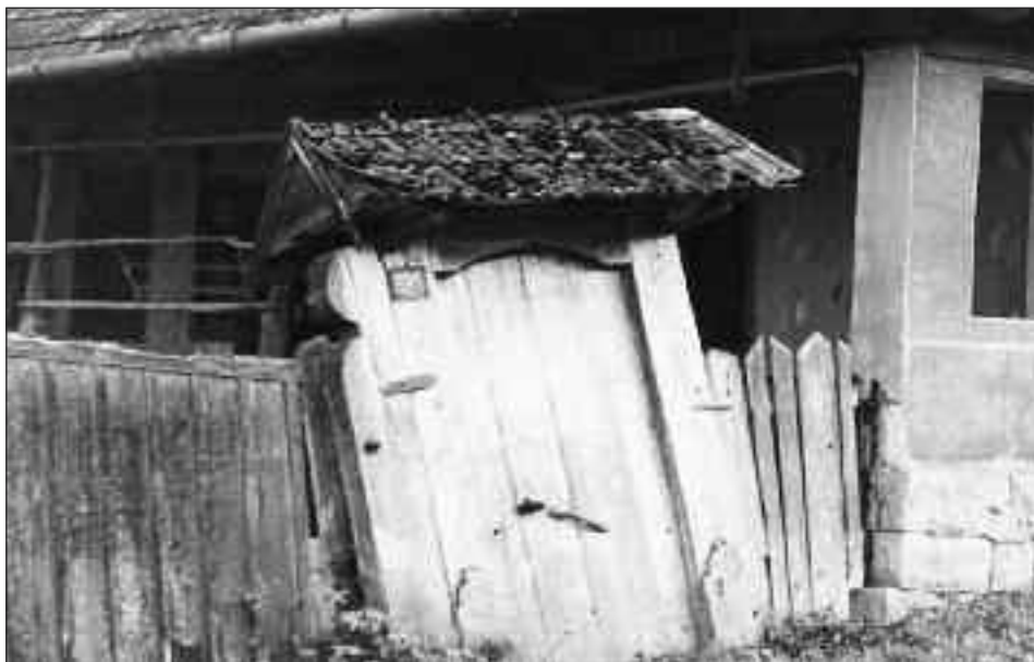
5. kép. Az elnéptelenedő Kalotaszeg – Vádalmás