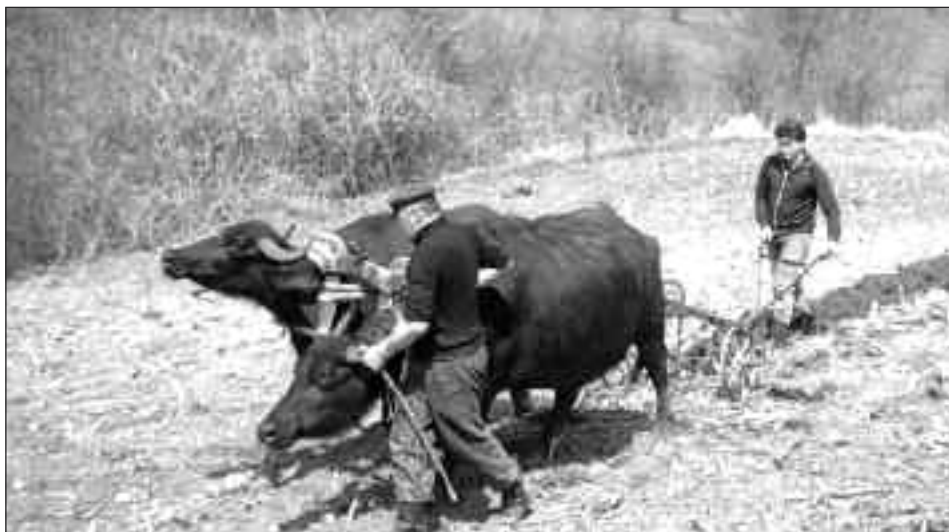
2. kép. A múlt kísértése. Szántás bivalyokkal – Inaktelke, 1993