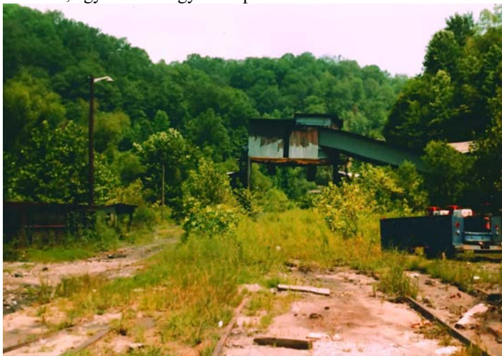
9. ábra: A Himler bánya 1981-ben

világkörüli utazásra szánta magát, viszont nem sokkal később már felröppent a hír, hogy „súlyos beteg”. 173 A volt szövetkezeti bányabárá és „salzburgi fejevadász” 1961. július 8-án egy kaliforniai kórházban hunyta le szemét. 174 Hollywoodban, a Forever Cemeteryben temették el. 175 A valamikor szebb napokat látott, kúriaszerű Himlerville-i háza 1991-ben felkerült a nevezetes történelmi épületek listájára; a település egyik utcája őrzi az alapító nevének, egy eltűnt magyar település történetének emlékét. 176