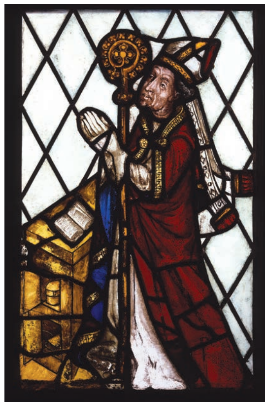
3–4. kép: Kanizsai János üvegablak ábrázolása az 1941-es publikációban és mai fényképen