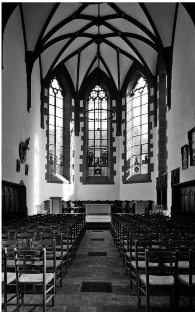
7. kép: A karthauziak egykori templomának belseje, az apszis középső ablakán a Kanizsai János esztergomi érsek által készített három üvegfestménnyel

BBC magyar műsorában elhangzott előadásában. „Csé” bázeli esszéjét Kántor Lajos a Kortársban idézte fel 2005-ben. 7