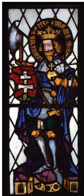
5–6. kép: Szent László üvegablak ábrázolása az 1941-es publikációban és mai fényképen

li Kanizsai III. János (1350 k.–1418. május 30.) esztergomi érsek volt, aki 1387–1418 közt ült az érseki székben. Az ablakok keletkezési ideje 1418-ra tehető, amikor Kanizsai János részt vett a konstanzi zsinaton. Az érsek címere Ulrich Richental Concilienbuch -jének kéziratában, majd 1483-ban kiadott nyomtatott változatában is, hasonló formában és színezéssel szerepel. 4 A Szent Lászlót ábrázoló üvegablak ikonográfiai jellegzetességei alapján valószínű, hogy mindhárom üveggépet Magyarországról hozott rajzok alapján készítették.