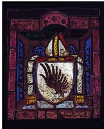
1–2. kép: Kanizsai János címere C. H. Baer 1941-es könyvében és mai állapotában

ták meg a bázeli egyetemre, hogy az ottani élettani intézetet vezesse. 2 Képekkel is illusztrált közleménye adataiban Rudolf Friedrich Burckhardt 1916-ban megjelent, alapos tanulmányára támaszkodott. 3