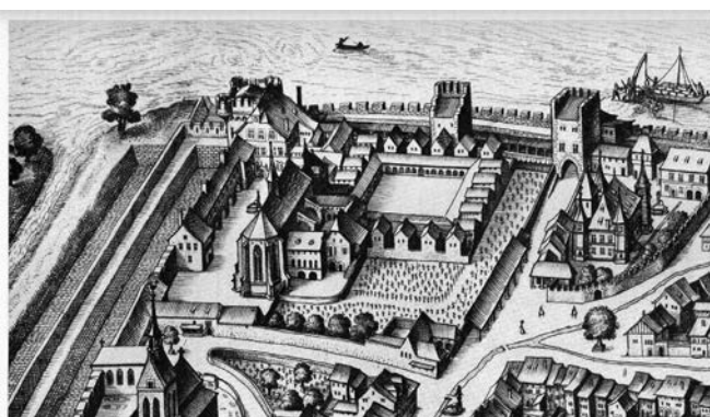
8. kép: A karthauziak kis-bázeli kolostora és temploma Merian metszetének részletén (Frankfurt, 1614. Közli C. H. Baer idézett monográfiája)

ólomkeretének mintázata ugyanis nem egyezik meg rajtuk, helyenként pedig a restaurátori kiegészítések nyomai is kivehetők a fényképek összevetésekor. A hosszú időre a Historisches Museumba került üvegeket újabban visszavitték a templomba, ám nem eredeti helyükre, hanem az apszis középső ablakára helyezték fel mindhármat. Talán megerősítésük érdekében töltötték ki az üres részeket kis rombusz alakú ólomkeretekkel. A választ a helyszínen vizsgálódó magyar művészettörténészeknek kellene megadniuk a továbbiakban.