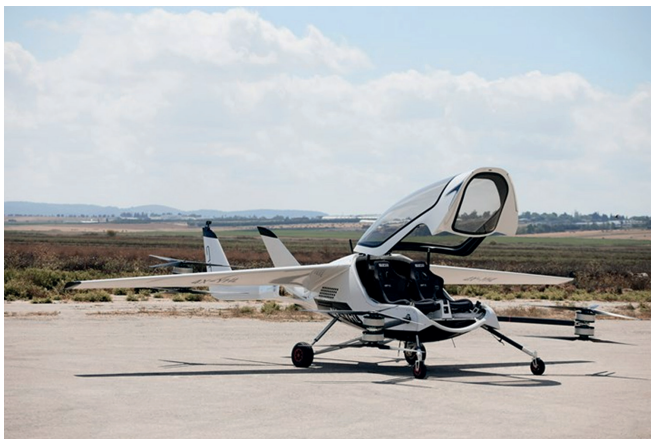
10. ábra A vészelhagyás lefelé nem lehetséges [11]

Kisszámú utas esetében (1–2 fő) lehetséges lehet a sportrepülőgépeken elterjedt mentőernyők alkalmazása, amely személyi felszerelésként használható. Hátránya, hogy csak abban az esetben lehetséges a biztonságos menekülés, ha a fedélzeten tartózkodók ismerik a gépelhagyás folyamatát és az ejtőernyő szakszerű használatát. A fentiekből következik, hogy ez a megoldás szinte kizárólag magáncélú felhasználás esetén jöhet szóba, megfelelő kompetenciákat és a légi jármű megfelelő szerkezeti kialakítását feltételezve. Amennyiben a légi jármű kialakítása nem teszi lehetővé annak biztonságos elhagyását lefelé (10. ábra), lehetőség van a katonai légi járművekhez hasonló vészelhagyásra.