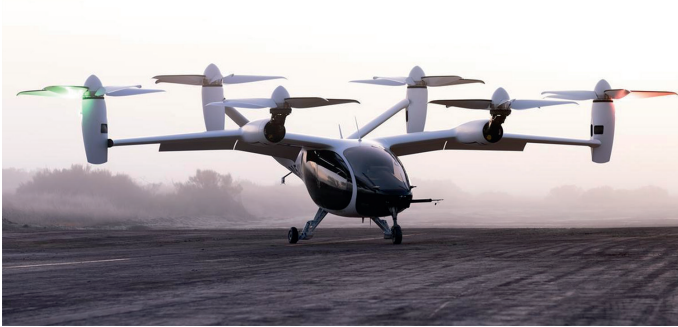
5. ábra A Joby Aviation repülőgépe [7]