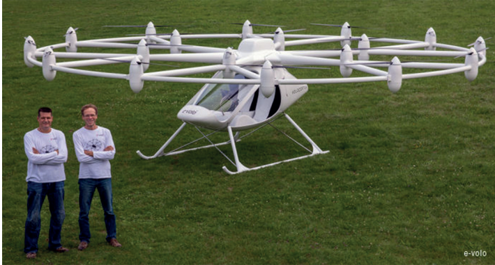
1. ábra Volocopter VC200 [3]

A DVR az EASA által létrehozott tervhitelesítési jelentés, amelynek kiadását a dróngyártók vagy üzemeltetők kérhetik az EASA-tól egy meghatározott feladatra használt drónra.