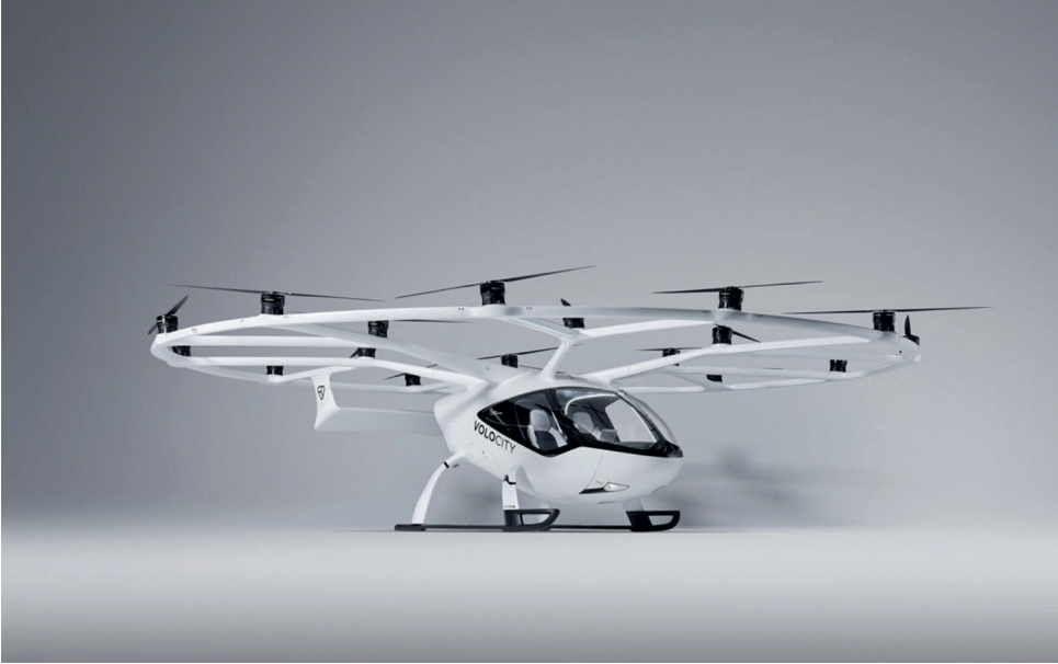
2. ábra VoloCity [4]