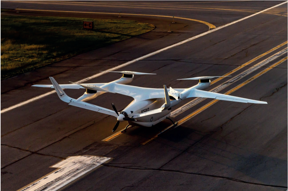
4. ábra A Beta Technologies által kifejlesztett Alia [6]

A második tervezési irányzat az „Emelkedj és utazz” (4. ábra), amely a függőleges fel- és leszállásokhoz használható multikopter dizájnt kombinálja a hagyományos repülőgéppel. Ebben a koncepcióban a repülőgépnek van egy szárnya, amelyen az emelő hajtóművek és légszárak találhatók. Ezek biztosítják a függőleges mozgást. Az emelő légszárak a függőleges felszállás és leszállás, valamint a lebegés során használatosak. A vízszintes haladáshoz a hossz tengelyen vagy annak irányában elhelyezett további erőforrást helyeznek el.