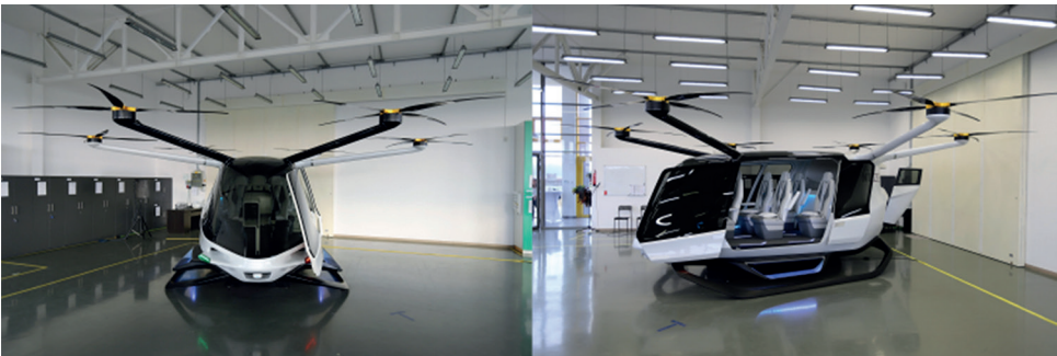
3. ábra A Kaliforniai Alaka'i Technologies által fejlesztett Skai típusú multikopter [5]

Ez a kialakítás egyszerű és hatékony (2. és 3. ábra). A multikoptereknek nincsenek szárnyaik, a hatótávolságuk a hagyományos légi járművekhez képest kisebb, az energiafogyasztás pedig nagyobb, mivel a szárnyak hiányából adódó aerodinamikai felhajtóerő-szükségletet a légcsonkcsavarok és a motorok teljesítményével kell kompenzálni.