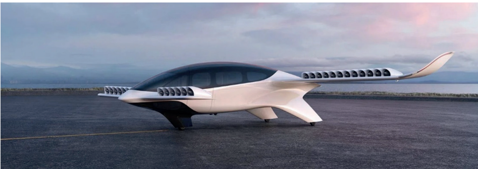
6. ábra A német Lilium Jet [8]

Az eVTOL-piacon megtalálható a tolóerővektor-eltérítéses irányzat is (6. ábra). Ennél az irányzatnál a merev szárnyakon ventilátorcsatornákat alkalmaznak (7. ábra). Ezekben a csatornáknak (8. ábra) helyezték el a villanymotorral hajtott lapátkoszorúkat (EDF 26 ) a függőleges és vízszintes repülési üzemmódhoz, az elosztott elektromos meghajtás (DEP 27 ) koncepcióját alkalmazva. Ez a rendszer nagyon hatékony, és csendesebb a korábban ismertetett irányzatoknál.