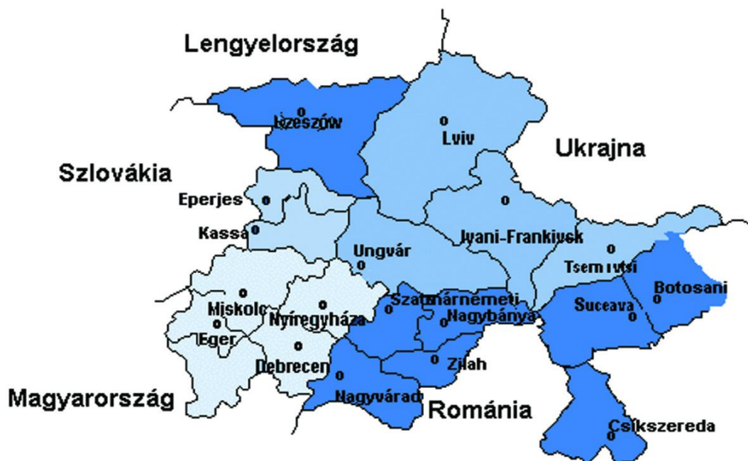
2. ábra: A Kárpátok Eurorégió közigazgatási egységei, 1997

A határokon átnyúló együttműködések tervezése megindult, érték is el kisebb sikereket, de az egész térséget átfogó, s különösen nem átformáló folyamatokról és eredményekről nem beszélhetünk. A szerveződés működése különböző okoknál fogva többször megakadt (SÜLI-ZAKAR 2003) Lengyelország, Szlovákia, Magyarország, majd Románia EU belépése minden tekintetben új helyzetet teremtett az egész térségben.