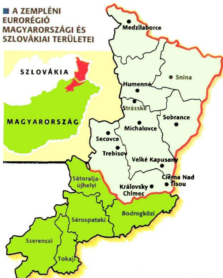
3. ábra: A Zemplén Euro régió területe

Az együttműködés szorgalmazója Sátoraljaújhely volt, a történelmi Zemplén megye egykori központja. A valóságos települési „erőviszonyok” alapvetően megváltoztak a több évtizedes csehszlovák településfejlesztési politika eredményeként. Sátoraljaújhely volt járási székhelyei közül egyesek „túlfutottak” a városon (népességszám, gazdasági potenciál, intézményi ellátottság), mások pedig „ráfutottak”. Bonyolultabbá váltak a városközi együttműködés keretei a későbbiekben az EU keretei között.