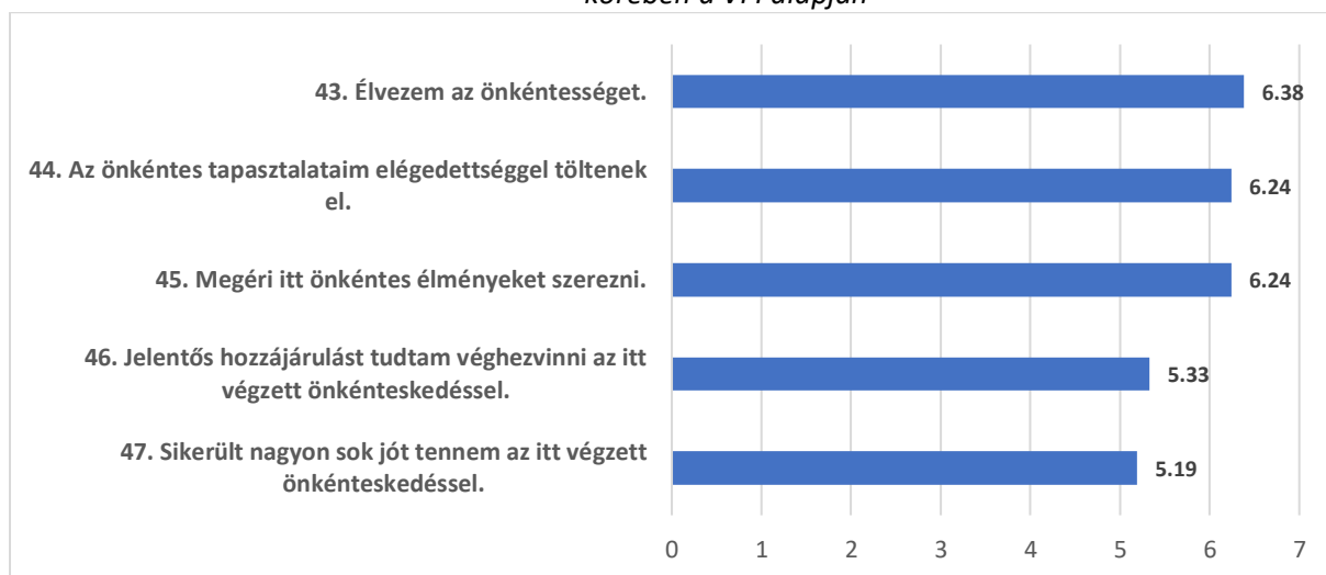
2. ábra. Az önkéntesek elégedettsége a VEB2023 EKF „Ragyogók” Önkéntes Program önkéntesei körében a VFI alapján

A VFI második részének végén található, elégedettséggel kapcsolatos állítások értékelése során a 21 önkéntes által megadott pontszámok átlagát összeadtuk, és a maximális 35 pontból 29,38 pontot kaptunk. Ez 83,94 százalékos átlagos elégedettségi arányt jelentett a VEB2023 EKF önkéntes szervezet vonatkozásában, ami magas átlagos elégedettséget mutatott. Az elégedettségre vonatkozó öt állítást a 2. ábrán látható módon pontozták.