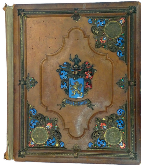
1. ábra: A Boda-díszalbum borítója