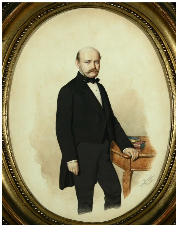
3. kép. Canzi Ágoston: Semmelweis Ignác eljegyzési képe