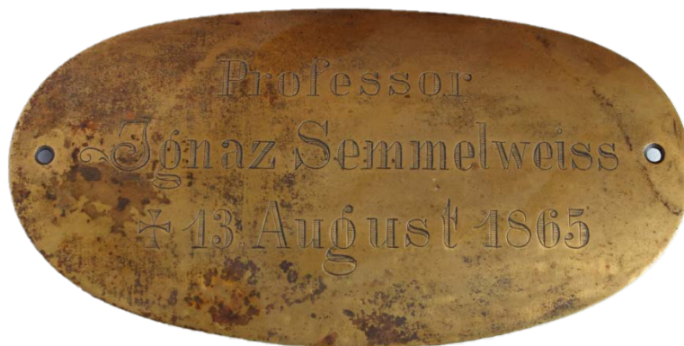
6. kép. Semmelweis Ignác sírkeresztén volt névtáblája.