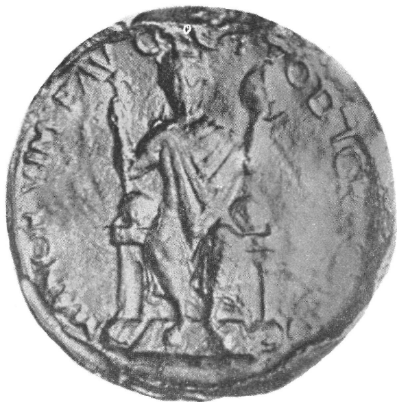
3) III. Ottó pecsétje (—1002)