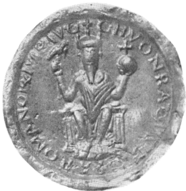
5) II. Konrád pecsétje (1024—)