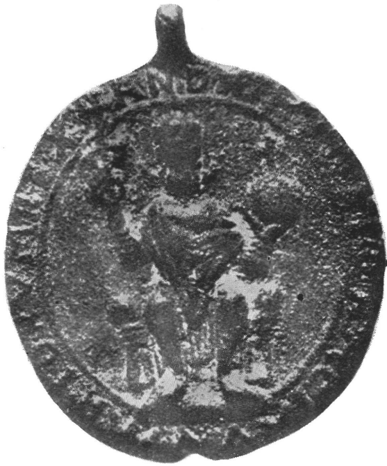
1) I. Endre ércbilloga (1046—1060)