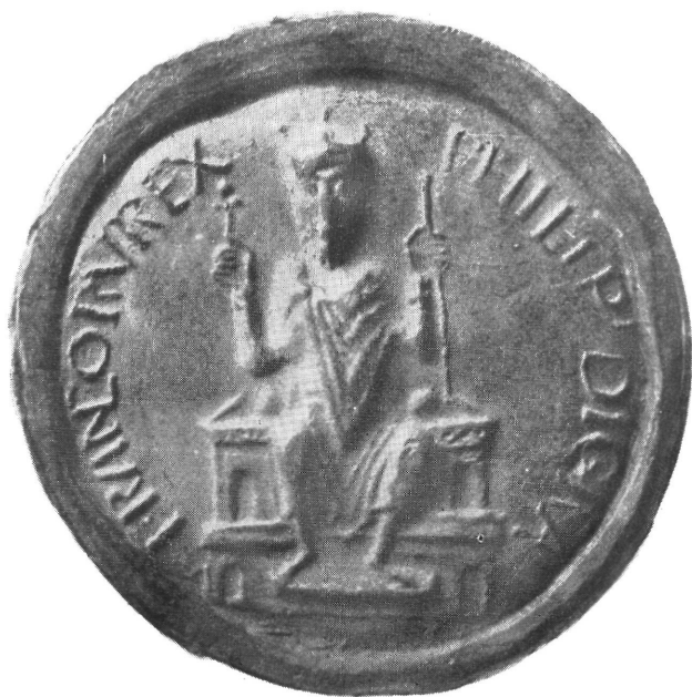
6) I. Fülöp francia király pecsétje (1059—1108)