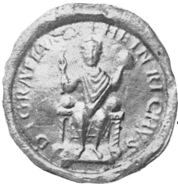
4) II. Henrik pecsétje (1002—1024)