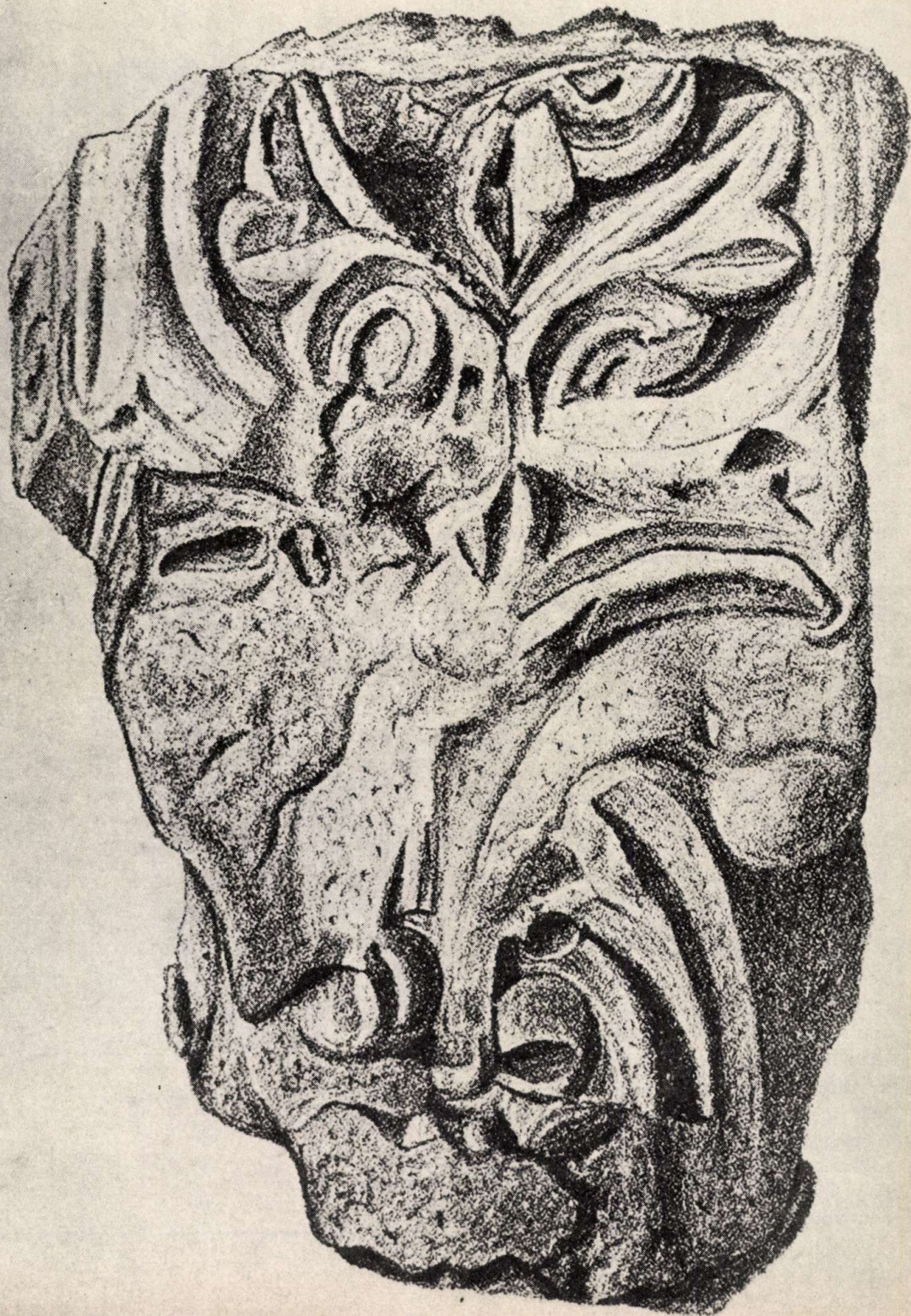
Románkori oszlopíő Pusztaszerről

A modern történettudomány az archeológia, a nyelvészet és számos más tudomány segítségével felderítette, hogy ez nem egészen