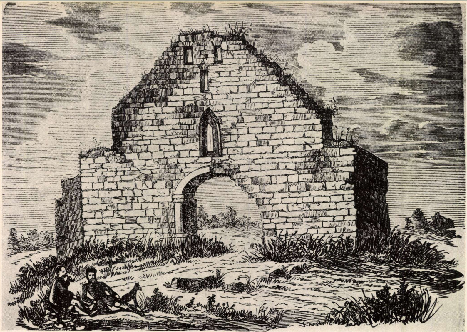
A szermonostori apátság romjai 1836-ban

Ez a Ferenc József-i kor, az Osztrák–Magyar Monarchia számláját terheli. De megterhelte a maga számláját a Horthy-korszak is azzal, hogy a felső-pusztaszeri területen (a volt kecskeméti birtokrészen) 1934-ben új községet szerveztek, amit Pusztaszernek neveztek. Ezzel teljes lett a zűrzavar: a szeri helyszín nevét az örgróf kedve szerint meghamisították, az igazi nevet pedig átvitték