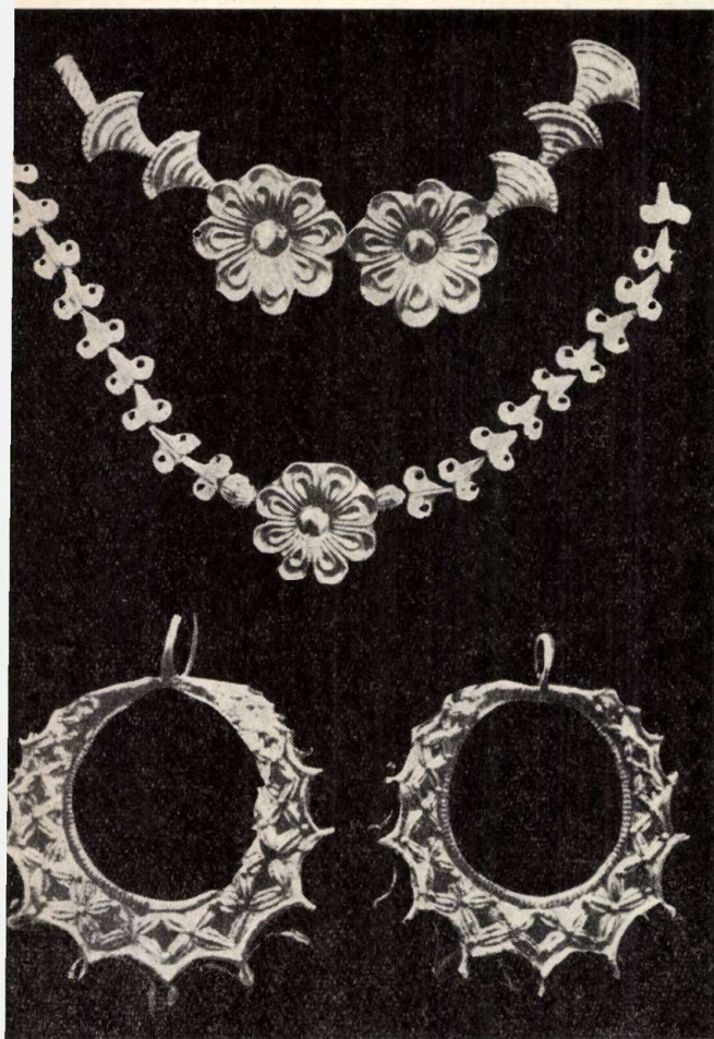
Mükénéi stílusú ékszerek. A tülbevaló a Schliemann által feltárt III. aknasírból került napvilágra