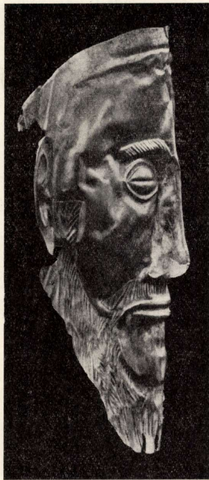
A nevezetes Agamemnón-maszk

lóan gyakorlatias érzékű sajtópropagandája által méreteiben még fel is duzzasztott – kincs előkerülése egyszeribe felkeltette a legszélesebb körök érdeklődését: első ízben történt meg az (és azóta is mily ritkán!), hogy egy régészeti kutatás eredményei a világlapok címlapjaira kerültek; az archeológia néhány tudós tiszteletre méltó egyéni érdeklődéséből a „közügy” szintjére emelkedett. Schliemann-nak – objektíven is bámulatos eredményei mellett – azt a képességét is tudománytörténeti érdemének kell tekintenünk, hogy nemcsak izgalmas lelete-