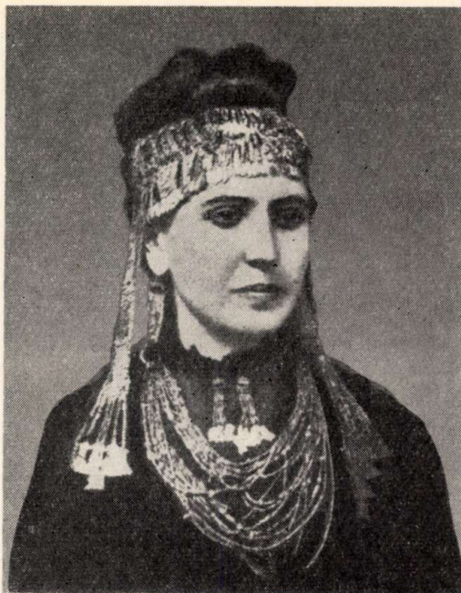
Schliemann felesége a „Priamosz kincsből” származó ékszerekkel

Első kísérlete egy „homéroszi” táj régészeti feltárására: az Ithaké (a mai Leukas) szigetén folytatott ásatása (1868) még nem hozott „szenzációs” felfedezéseket: Odüsszeusz palotáját nem sikerült megtalálnia. Ámde sajátos módszere számos, ma is érvényes részleteredményre vezetett. A „szenzáció” csak második nagy ásatási kampányában, Trója feltárásakor született meg. Hosszas előkészületek és előzetes tanulmányok után – melyek során, ismét csak a homéroszi eposzok adatainak „komolyan vétele” alapján az egykori Ilion várának helyét sikerült meghatározni az akkori Hisszarlik dombon – 1870-ben indította meg több éves ásatásait az általa meghatározott térségben. A feltevés helyességét a kezdeti eredmények hamarosan igazolták: a domb felszíne alatt nem is egy, hanem több, egymásra épülő település maradványai kerültek elő. Schliemannt csak a „legrégebb”, a Homérosztól megénekelte Trója (azaz: Ilion) felfedezése izgatta. A későbbi – római, hellénisztikus és görög – települések rommaradványait kiméletlenül szétverve (és ezzel jövőtehetetlen károkat is okozva) haladt előre az egyre régibb rétegek felé. Végül, 1873-ban egy egykori palotakomplexum és hozzá vezető utak, díszkapuk maradványai kerültek elő: a félreérthetetlen égési nyo-