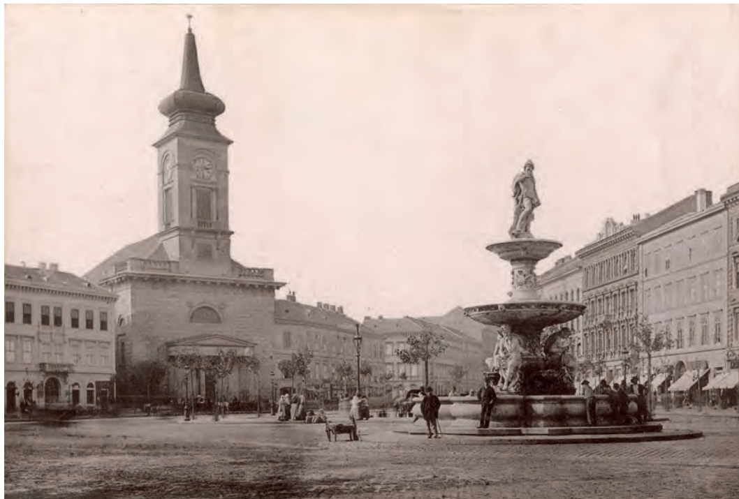
A Kálvin téri templom Budapesten, a Dunamelléki Református Egyházkerület központja (Kiscelli Múzeum)

ügyeinek intézésében, ahogy Török Pál püspöknek írt levelei is 1874-től szaporodnak meg. Lónyay Menyhért főgondnokságának legnagyobb eredménye az egyházi közalap megteremtése. Már 1860-ban, a pátensharc idején arról értekezett a Protestáns Egyházi és Iskolai Lap hasábjain, hogy szükséges lenne ilyen közalapra az el-