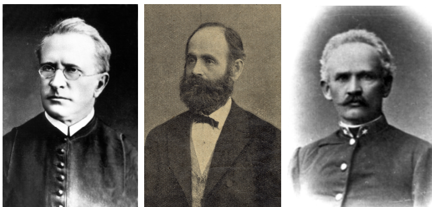
Figure 4. (left) Alfonz Sándor Freh (1832–1918); Figure 5. (middle) Dr. Antal Waisbecker (1835–1916); Figure 6. (right) Vilmos Piers (1838–1920).

published many new data for the flora of Vas County (Waisbecker 1893, 1895, 1897, 1899a,b, 1901, 1903, 1904, 1905, 1908). As a sharp-eyed taxonomist, he wrote about the ferns of the county (Waisbecker 1902), and he also described several new taxa of flowering plants. His most notable species discovery is the Transdanubian Sedge ( Carex fritschii Waisb.) (Waisbecker 1894). He donated about two and a half thousand sheets of his valuable plant collection to the Vas County Museum (now known as the Savaria Museum), founded in 1908. The material, named Flora of Vas County (mainly from the Kőszeg region), is still kept here. 16 The rest of his collection was transferred to the Department of Botany of the Hungarian National Museum, and its sheets are now kept in the Herbarium of the Botanical Department (BP) of the Hungarian Natural History Museum (see below HNHM). 17