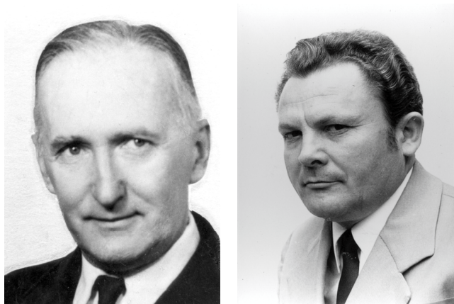
Figure 12. (left) Dr. József Jeanplong (1919–2006); Figure 13. (right) Ernő Horváth (1929–1990).

information on the Narcissus poeticus subsp. radiiflorus occurrences in the Alpokalja (Vöröss 1987).