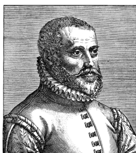
CAROLVS CLVSIVS. Tū qui PANNONIAE uisitatione lūta in hortis, Quaeque horti radice lūta in HESPERIIS, Ac flores aliq̄ue herbas productas in oras, Clusi, et in hoc horto siccatus unus eris.

important botanist in the world during his century ( Figure 1 ). 5 His patron and host at the castles in Güssing and Stadtschlaining was the humanist Hungarian lord and Turkish-battling general Boldizsár Batthyány (1537–1590), with whom he was acquainted from the scholarly circles of the imperial court in Vienna. The third colleague of the so-called Güssing School was Batthyány's Protestant clergyman, religious orator and religious writer István Beythe (1532–1612), who often guided Clusius through Vas County landscapes ( Figure 2 ). Their cooperation resulted in a book on flora that was the first of its kind in Hungary and second in Europe, the Description of the plants observed in Pannonia, Austria and the neighboring provinces (Clusius 1583), but only a small part of its floristic data is from the area of today's Hungary and Vas County. 6 In addition, Clusius and István Beythe compiled the first independent publication on this subject, the List of Pannonian plant names in Latin and Hungarian, which also marks the birth of the science of ethnobotany in Hungary (Clusius and Beythe 1583; Clusius 1584) ( Figure 3 ). István Beythe's son was András Beythe (1564–1599), whose book Fives könyv (Book on Herbs) was the second of its kind in the Hungarian language (Beythe 1595). 7