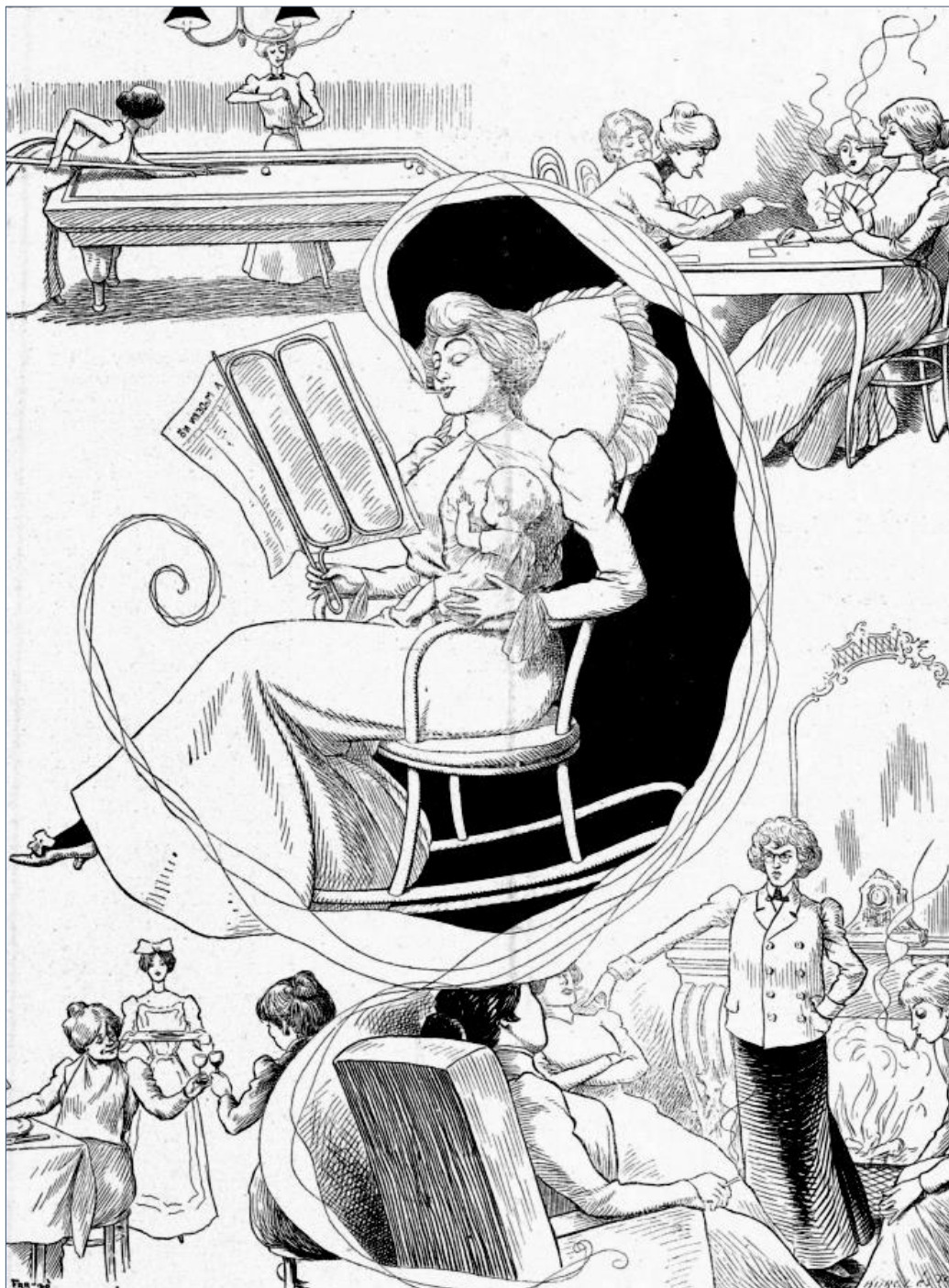
Faragó József: Asszonyok klubja Forrás: Új Idők, 4(51), (1898. december 18.), p. 545. URL: https://bit.ly/3sSeqtH