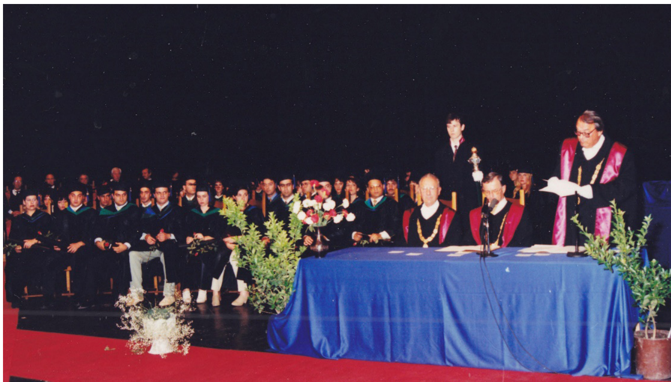
Gyógyszerészavatás dékánként, 1996-ban

Szakmai és közéleti tevékenységét számos kitüntetéssel ismerték el: Érdemes Gyógyszerész (1975), Kiváló Gyógyszerész (1985), Kazay Endre Emlékérem (1997, MGYT), Széchenyi Professzori Ösztöndíj (1998-2002), Szent-Györgyi Albert díj (2002), Bruckner Győző díj (2002), Schulek Emlékérem (2002), Pro Homine Nobile Pharmaciae (2004, MGYK), Életműdíj (2004, MOSZ), Magyar Köztársasági Érdemrend Kiskeresztje (1997) és Magyar Köztársasági Érdemrend Tisztikeresztje. Hallgatói is ismételtelen elismerték oktatói képességeit a III. évfolyam Legjobb Oktatója (2001, 2005), Best Lecturer, Best Practical Teacher díjakkal.