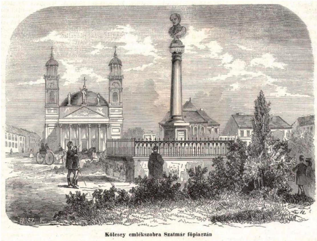
Kölcsey emlékszobra Szatmár főpiacán