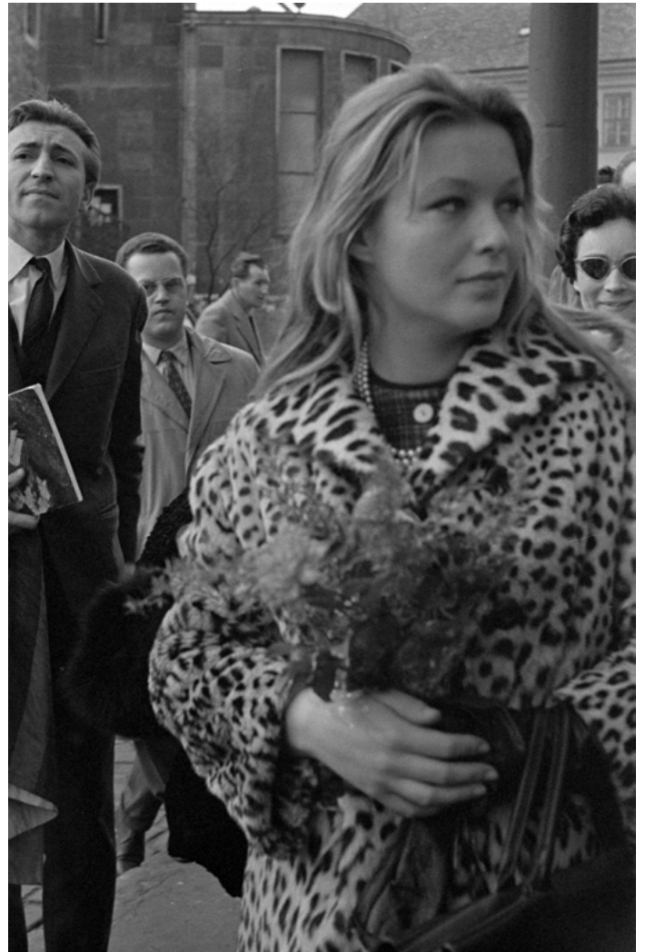
8. kép: Marina Vlady Pécssett, 1962 (szekr. kat. JA_2020_03_30_1585)