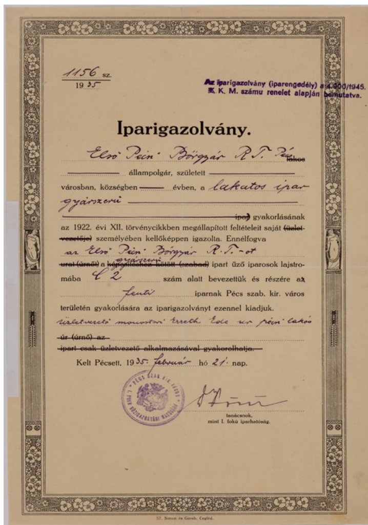
5. kép: Iparigazolvány az Első Pécsi Börgyár Rt. részére, lakatosipar gyárszerű gyakorlásáról, 1935 (, Ltsz.: I. 2020.12. 3.)