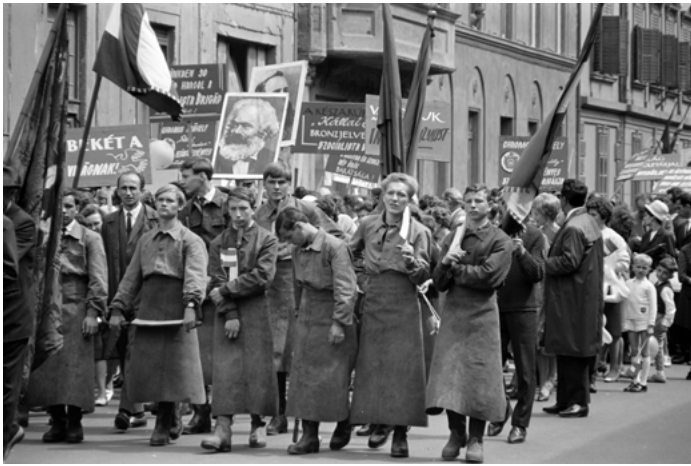
21. kép: Bőrgyári dolgozók, tímársegédek Pécsen a május elsejei felvonuláson, 1965 (szekr. kat. JA_2020_04_06_3288)