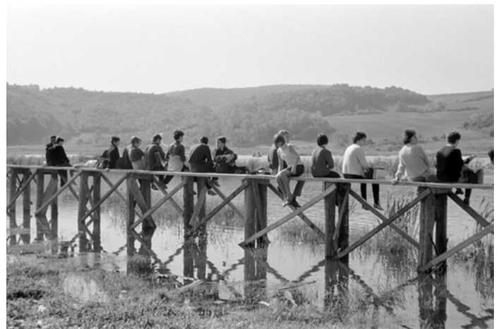
17. kép: Pihenők az orfűi stégen, 1966 (szekr. kat. JA_2020_04_02_2444)