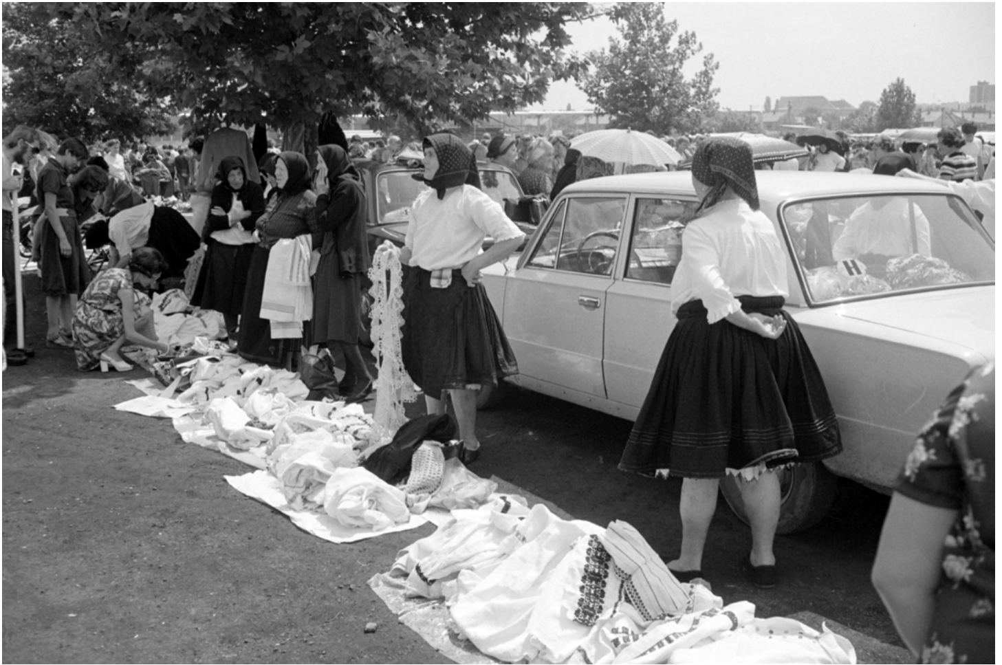
15. kép: A pécsi vásáron...1977 (szekr. kat. JA_2020_03_25_0547)