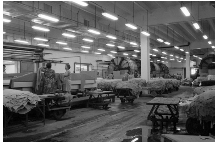
22. kép: Pécsi Bőrgyár, Sertésvelúr Csarnok (SEVECS). Sertésbőr cserző műhely, jobbra a háttérben 14 darab Triumph hordóval, 1977 (szekr. kat. JA_2020_04_15_4788)