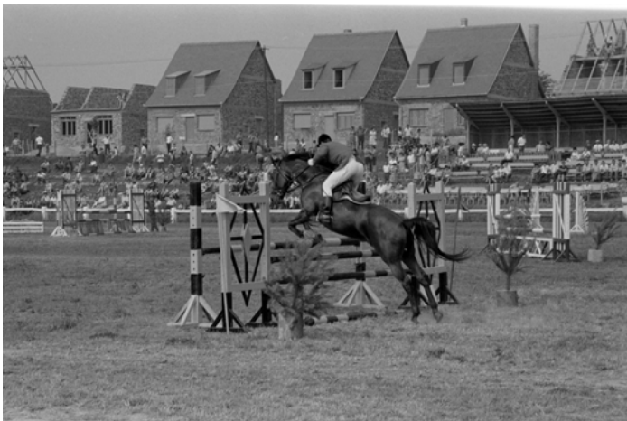
16. kép: Lóverseny Pécs-Üszögpusztán, 1980 (szekr. kat. JA_2020_03_26_1041)