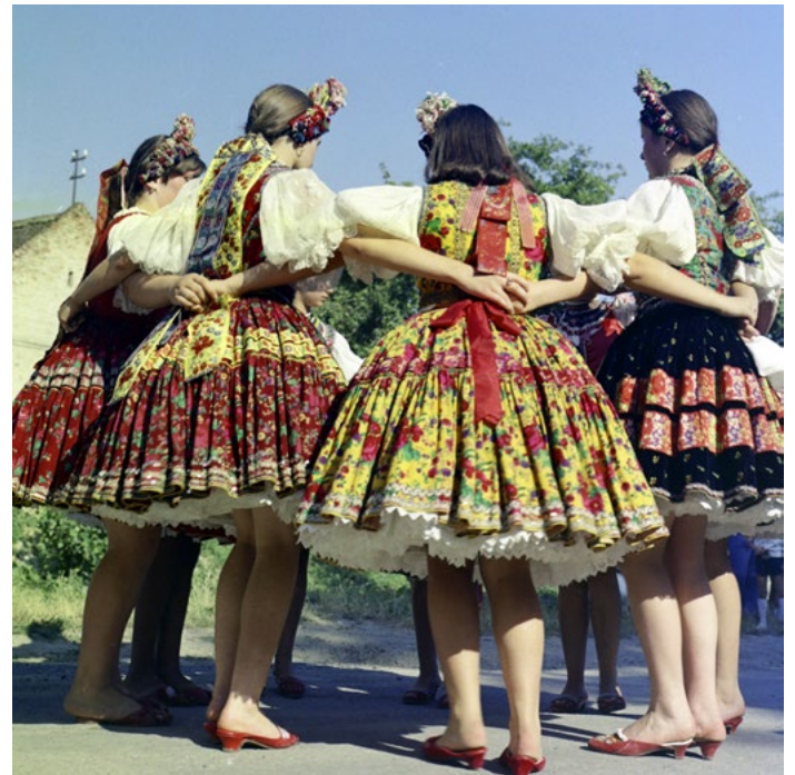
20. kép: Zengővárkony, népi táncosok, 1976 (szekr. kat. JA_2020_03_23_0132)