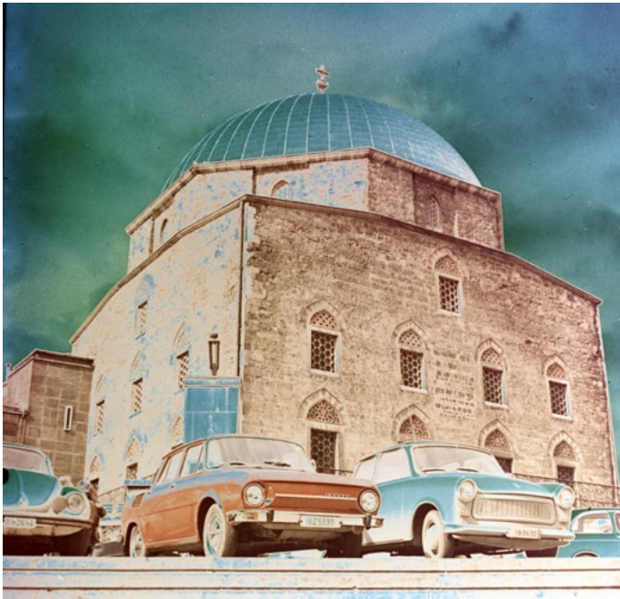
7. kép: Szolarizált fotó a dzsámiról – Pécs, Széchenyi tér, 1980 (Jakab Antal fotója, szekr. kat. JA_2020_03_23_0198)