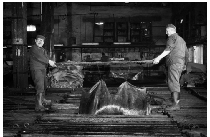
24. kép: Pécsi Bőrgyár, Cseres Csarnok, Gyorscserző műhely. Növényi cserzésű marhabőr krupon áthúzása léccel a másik kádba. 1987 (szekr. kat. JA_2020_04_16_4932)