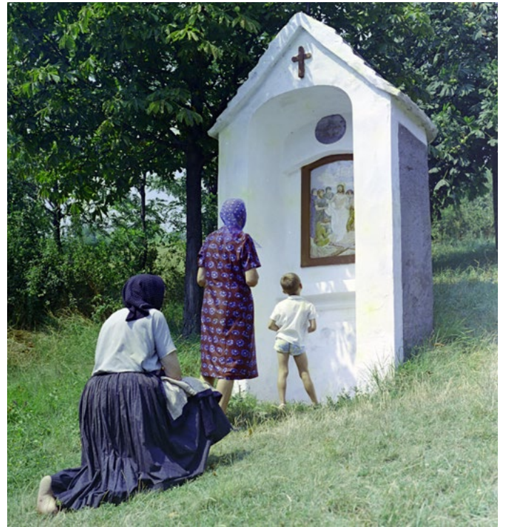
18. kép: Siklós-Máriagyűd, Kálvária, 1974 (szekr. kat. JA_2020_03_21_0018)