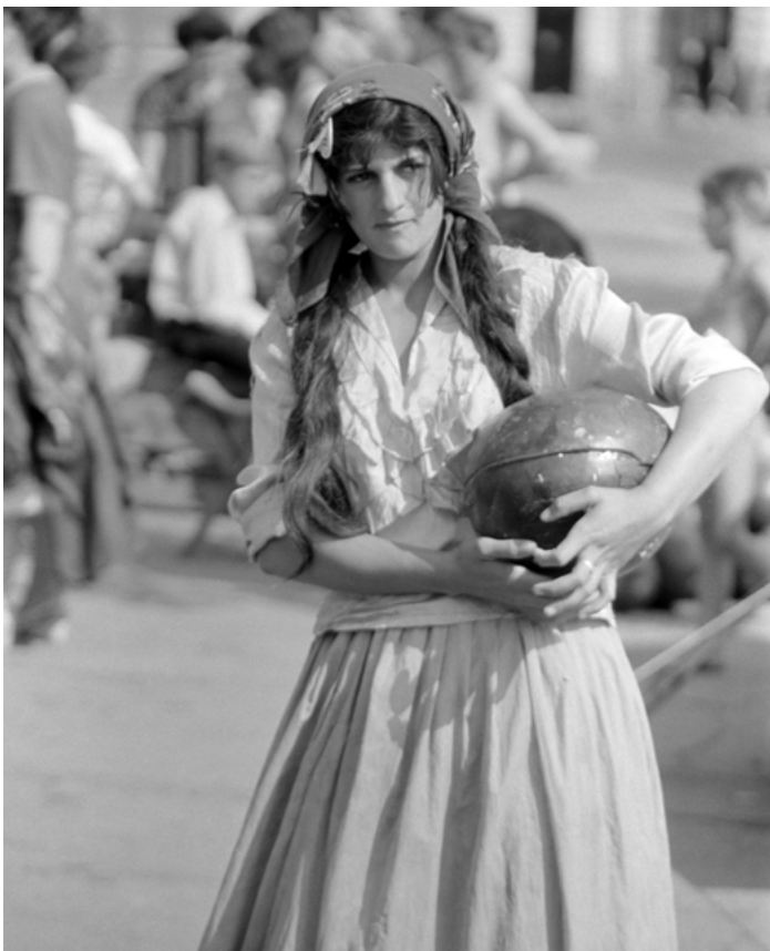
9. kép: Pécsi dinnyevásáron készült portré, 1966 (Jakab Antal fotója, szekr. kat. JA_2020_04_02_2417)