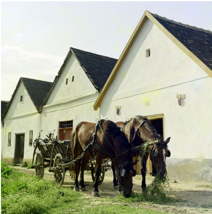
19. kép: Palkonya, picesor lovas kocsival, 1975 (szekr. kat. JA_2020_03_21_0044)