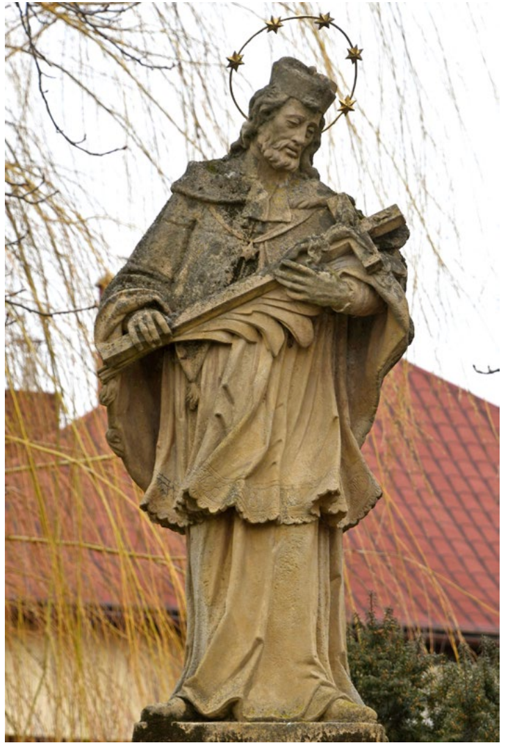
13. kép: Toponár Nepomuki Szent János-szobra

Hasonló indokokkal kell kizárnunk a lehetséges Buck-szobrok köréből az 1793-ban állított toponári Nepomuki Szent János-szobrot (13. kép). Jóllehet, a csillagot formáló melldísz egyszerűbb, mint a Buck-szobrokon, a megformálás viszont csaknem minden elemében ismerős, még az ikonográfiai szindaktilizmus is megfigyelhető. Ugyanakkor az arc és az öltözetdarabok elsőrangú részletezése, a súlyos reverenda nehézkes redői és a karing könnyebb anyagának mozgalmas, éles ráncokba törő esése kitűnő, Buckét meghaladó mintázókészségről vall.