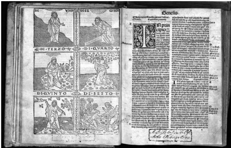
A velenői 1498. évi Biblia, Nr. 1.