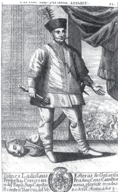
Gróf Esterházy László (1626–1652) Rézmetszet a Trophaeum Nobilissimae ac Antiquissimae Domus Estorasianae... c. műből (1700)