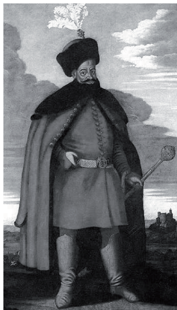
Batthyány (I.) Ádám (1610–1659) portréja, 1650 k. Magyar Nemzeti Múzeum, Budapest