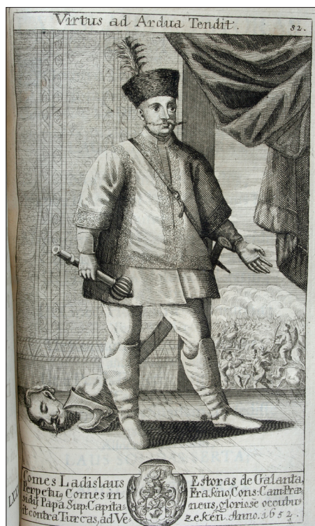
Esterházy László képmása a Trophaeum Domus Estorasiae című kiadványban

A megyei és az országos politika szereplői számára is ígéretes jövő előtt álló „szép gróf”-ot vonzotta a vitézi étellel járó katonai virtus, gyakran vett részt portyákon apósa, Batthyány I. Ádám (1610–1659) oldalán, s mint jó vitéz, szerette a lovakat. 14