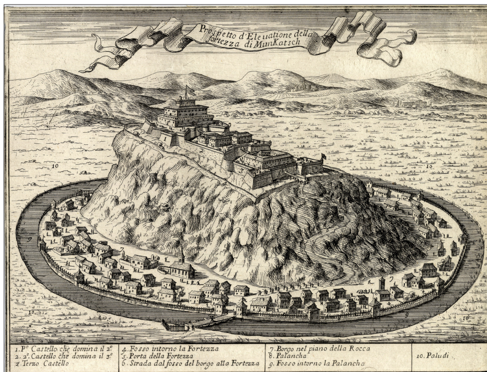
Munkács látképe 1700 körül. Rézmetszet

Magyar Korona joghatósága alá. 39 A Magyar Királyságban élők – így az Esterházy család – történelmi jelentőséget tulajdonítottak az eseménynek. Erre utal Olasz-Kolozsvár István feljegyzése, aki korábban Esterházy László nevelője volt és Miklós nádor halála után egy ideig a fraknoi vár gondviselője is: 40 „[1647] 24. septembr jöt megh az Úr Eő Nga [László] Kysmartonbol Pál Ural eő Ngaval egiüth, 26. itt, esmég Kysmartonban ment Eő Nga, onét Rohoncra az nap, Ugian az napon Aták vissza magyar Országghoz Kismartont, a kit 5. Esztendő heian záz eghéz Eztendeigh Austriához birtak, az Teöbit is ugi mint Szarvkeöt, Keözeghet Borostiant. etc.” 41