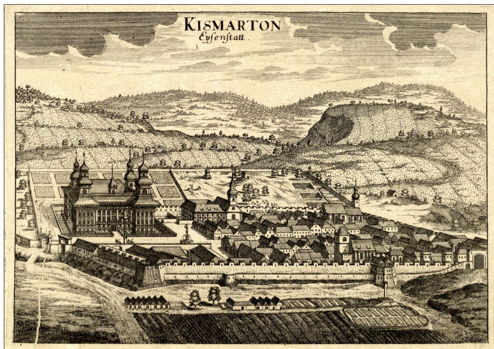
Kismarton látképe 1680 körül. Matthias Greischer rézmetszete

A két főúr szoros kapcsolata még szembetűnőbb, ha figyelembe vesszük, milyen gyakorisággal találkoztak személyesen. Batthyány Ádám itineráriuma az elsődleges forrás ebben a tekintetben. 54 A feljegyzések szerint az 1648-as, illetve az 1650–1652-ig terjedő években majdnem minden hónapban találkoztak. Rendszerint (az esetek döntő többségében) László kereste fel Ádámot Németújvárott vagy Rohoncon, de előfordult az is, hogy máshol, különböző események alkalmával találkoztak. Így például 1646. július 18-án Pozsonyban, amikor Batthyány Ádám Pálffy Pállal együtt – Esterházy László előzetes kérésének eleget téve – személyes jelenlétével igyekezett segíteni és előmozdítani Esterháznak a Nádasdy Ferencsel folytatott, Kismartont érintő birtokper sikerét. 55