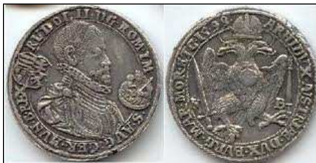
3. kép A nagybányai pénzverdéből származó pénzveret (1599) I. Rudolf magyar király képével