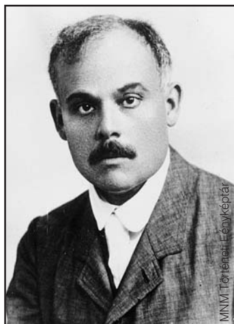
Jászi Oszkár, 1919

Jászi Oszkár (1875–1957) Károlyi Mihályhoz intézett levelében így jellemezte a magyar kormányt: „mai összetételében hiányzik az a demokratikus elszántság, merész kezdeményezés és forradalmi lendület, amely egyedül menthetné meg szerencsétlen hazánkat a mai tragikus helyzetben”. A nemzetiségi miniszteri posztját összesen 80 napig betöltő Jászi értékelése kétségkívül híven tükrözte a Károlyi-kormány belső helyzetét.