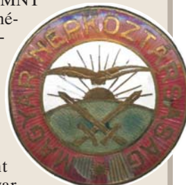
A MNK katonai melljelvénye, 1918. MNM Éremtár