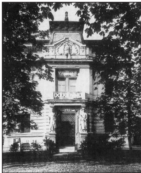
A Tatra Bank épülete, itt alakult meg a Szlovák Nemzeti Tanács. Turócszentmárton, 1918

Jászi a sikertelen szlovák tárgyalások után vált először fogékonyabbá az aktív honvédelem alternatívájára. A Hodža-tárgyalások után, a Bartha-Hodža megállapodás előtt, a felvidéki területek magyar kiürítését követelő Vix-jegyzéket a Jászi által megfogalmazott kormányproklamáció a belgrádi konvenció (a magyar kormány és az antant balkáni haderőinek képviselői által 1918. november 13-án aláírt, többek között a déli és keleti demarkációs vonalakat megállapító fegyverszüneti egyezmény) megsértéseként értékelte. A szlovák tárgyalások csődjét nehezen dolgozta fel a magyar minisztertanács. Mégis az ülésen megállapodás született arról, hogy a helyzet alkalmatlan az aktív honvédelem meghirdetésére. Abból kiindulva, hogy „a kormánynak nincs hatalmában e követeléseket és tényeket megváltoztatni”, nyilatkozatot adott ki a nemzethez: „hajoljatok meg e kényszerűség előtt, ne nyújtsatok alkalmat, sem ürügyet arra, hogy összeütközésre vagy éppen vérontásra kerüljön sor. Ne feledjétek, hogy minden ilyféle eset rontaná helyzetünket a nemsokára összeülő nemzetközi békekonferencián. Mert mi még