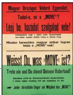
MOV E-plakát, 1918

kinyilvánítja az ország csatlakozását Szerbiához.