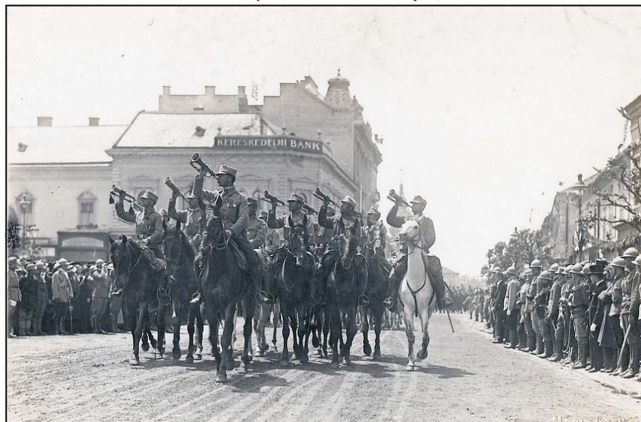
A román csapatok bevonulása Erdélybe, 1918

A kormányban ily módon háromféle álláspont alakult ki Magyarország integritásának kérdésében. Jászi Osz-