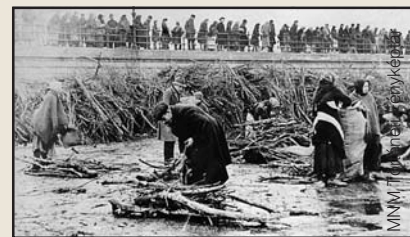
Szénhiány. Uszadékfát keresők a Dunán

december 28. Szénhiány miatt a minisztertanács 1919. január 1-jétől bezárja a színházakat és a mozikat.