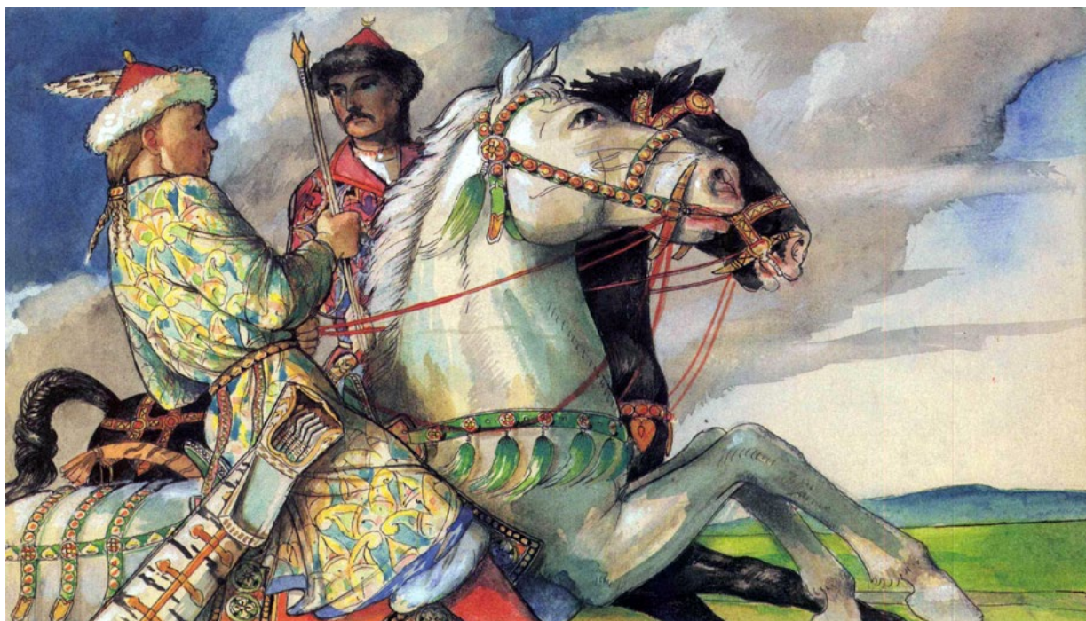
1. kép: Hunor és Magor . László 1991, 8. oldal nyomán