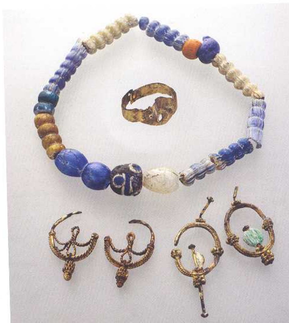
18. kép ■ Női ékszerek Vörs-Papkert B temetőből ■ Függőpárok 106. és 454. sír RRM 92.59.1; 96.46.1. Aranyozott bronz, kagyló. H: 2,8 ill. 4,4 cm ■ Gyöngysor 290. sír, RRM 92.149.1. Üveg ■ Pajzsos fejű gyűrű 301. sír, RRM 93.219.4. Bronz, Átm: 2,3 cm

Másfajta változásokat érzékelhetiünk Északnyugat-Dunántúlon, Sopron környékén, és a vele szomszédos Burgenlandban és Alsó-Ausztria területén egészen Mühlring-Hart, és a vele szomszédos Purgstall an der Erlauf, továbbá a Duna túloldalán fekvő Wimm lelőhelyekig, amelyek valamivel később, a 8-9. század fordulójától a 9. század közepe tájáig keltezhetők. Különösen érdekes a purgstalli 225 síros, teljesen feltárt temető, melynek a korai fázisában még avar kor végi öntött bronz övgarnitúrák és női ékszerek, majd Sopronkőhida-típusú leletanyag – köztük a női ékszerek ekkor megjelenő, és csak erre a térségre jellemző azonos fajtái (drótelkeszer-család) és viselési módja, továbbá a fegyverek –, a kései fázisban pedig már a Mosaburg/Zalavár környéki szolgálónépi temetkezésekre jellemző tárgyak kerültek elő. A temető horizontális sztratigráfiája szemléletesen, egyetlen példában összefoglalva igazolja azt az akkulturációs folyamatot, ami az avar kor végétől, és a Karoling-kor kezdetétől a Karoling Birodalom teljes berendezkedéséig tartó időszakot jellemzi a birodalom egész