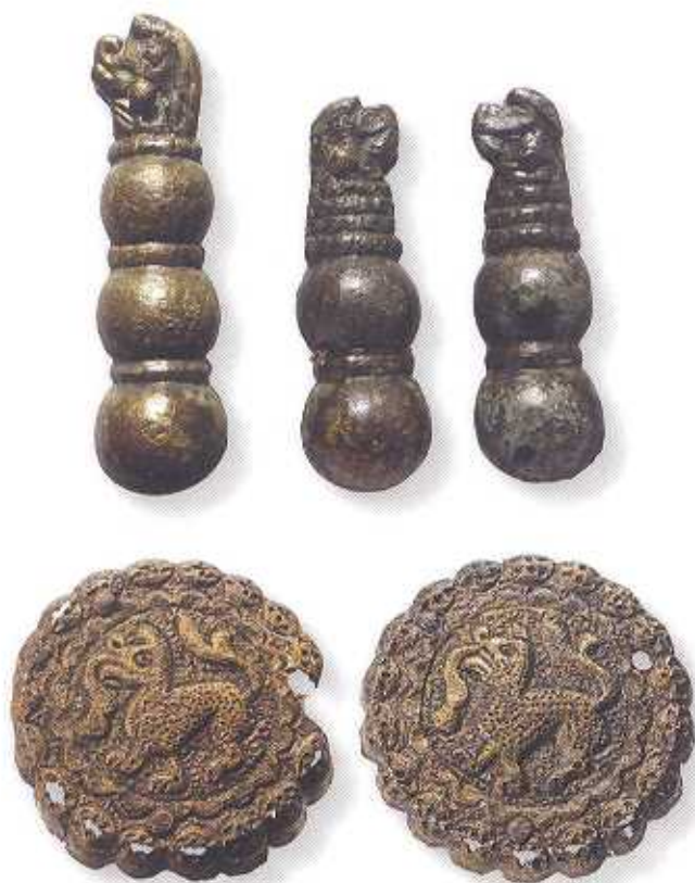
17. kép ■ Övveretek ■ Vörs-Papkert B 347. és 378. sír RRM 93.250.2; 96.26.6-7. Bronz, kerek veretek Átm: 3-3,1 cm; bábus díszű veretek H: 4,1-2,9 cm

Másfajta változásokat érzékelhetiünk Északnyugat-Dunántúlon, Sopron környékén, és a vele szomszédos Burgenlandban és Alsó-Ausztria területén egészen Mühlring-Hart, és a vele szomszédos Purgstall an der Erlauf, továbbá a Duna túloldalán fekvő Wimm lelőhelyekig, amelyek valamivel később, a 8-9. század fordulójától a 9. század közepe tájáig keltezhetők. Különösen érdekes a purgstalli 225 síros, teljesen feltárt temető, melynek a korai fázisában még avar kor végi öntött bronz övgarnitúrák és női ékszerek, majd Sopronkőhida-típusú leletanyag – köztük a női ékszerek ekkor megjelenő, és csak erre a térségre jellemző azonos fajtái (drótelkeszer-család) és viselési módja, továbbá a fegyverek –, a kései fázisban pedig már a Mosaburg/Zalavár környéki szolgálónépi temetkezésekre jellemző tárgyak kerültek elő. A temető horizontális sztratigráfiája szemléletesen, egyetlen példában összefoglalva igazolja azt az akkulturációs folyamatot, ami az avar kor végétől, és a Karoling-kor kezdetétől a Karoling Birodalom teljes berendezkedéséig tartó időszakot jellemzi a birodalom egész