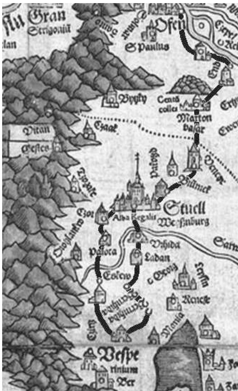
3. ábra. A Buda–Veszprém útvonal

Lázár-térképre mindkét változat berajzolható: a Fehérvártól indulva Csór (Czor), 45 Palota ( Palota ) és Öskü ( Eskeu ) érintésével haladó északi, illetve a Sárvízen Úrhida ( Urhida ), 46 Ladány ( Ladan , ma Nádasdladány) és Berénhida ( Berinhida , ma Berhida) érintésével haladó déli is. Berénhida kétszer