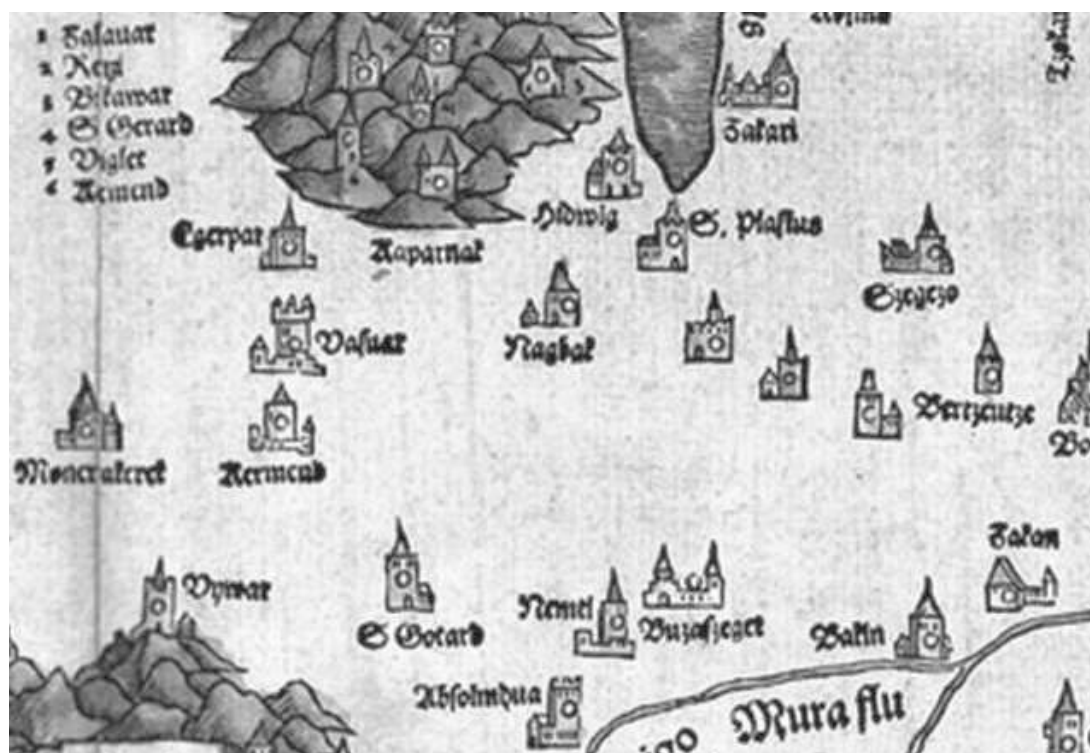
6. ábra. Vasvár–Nagykanizsa–Zákány térsége (az útvonalakat nem rajzoltam be)

Az útvonalak teljes körű berajzolásának korlátait azonban sokkal inkább azok a korabeli térképezési módszer pontatlanságaiból fakadó torzulások jelentik, amelyek miatt egyes területeken a települések térbeli rendje felborul és ennek megfelelően a berajzolható útvonalak is összekuszálódnak. Ilyen például a Délnyugat-Dunántúlon Vasvár–Nagykanizsa–Zákány térsége.