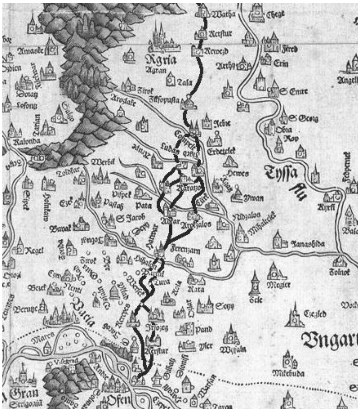
1. ábra. A Pest–Kassa útvonal első szakasza

Hatvan után a helyzet bonyolultabbá válik. Blazovich és Kubinyi is magától értetődőnek veszik, hogy a főút Hatvan után Gyöngyöst délről elkerülve közelítette meg Kompoltot ( Compelt ) és kelt át a Tarnán, igaz, Kubinyi Gyöngyös körzetében több mellékutat is feltüntet – az úthálózat bonyolult. Kubinyi és Blazovich ráadásul eltér abban, hogy utóbbi a központi helyként nem szereplő Adács és Nagyút falvakat is szerepelteti.