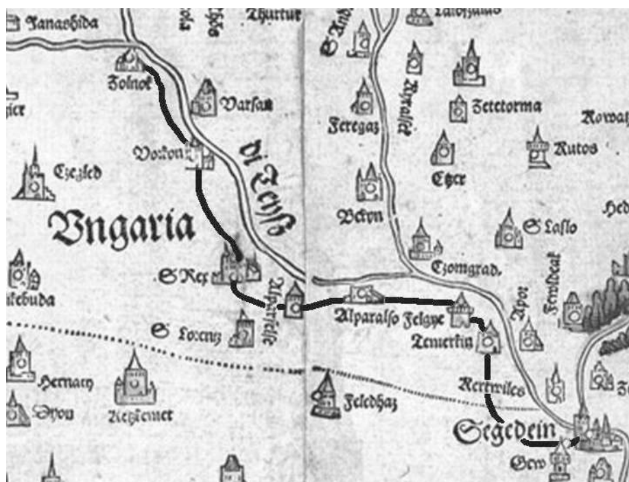
4. ábra. A Szolnok–Szeged útvonal

és Kengyel falut érintette, Kubinyi szerint azonban az út a két település érintése nélkül délebbre, a külön nem jelölt Tiszavezsenynél kelt át a folyón. A nehézséget az is jelenti, hogy a középkorban jelentős mezővárosnak számító Tiszavarsány a török hódoltság végére elpusztult, területe a mai Rákóczifalva belterületétől délre keresendő, így az útvonal pusztán térképi és okleveles források alapján nem tisztázható teljesen. A Tabula Hungariae -n azonban kizárólag Várkony és Varsány ( Varsan ) szerepel. 52 Ez szerintem arra utal, hogy az átkelés e két település között történhetett leginkább, ezért Blazovich rekonstrukciója tűnik valamivel meggyőzőbbnek. A következő település ezen az útvonalon a folyótól beljebb fekvő Szentkirály ( S. Rex ). 53 A nem túl jelentős falu a Kecskemét ( Keczemet ) és talán a Nagykőrös felől érkező alsóbbrendű utaknak lehetett a végpontja, de a térképi rekonstrukciókon nem szerepel; Lázár térképe tehát e ponton fontos adalékkal szolgál. A következő két falu Felsőalpár ( Alparfelse ) és Alsóalpár ( Arparalso ). Előbbi, hetivásáros hely, a mai Lakitelek helyén feküdt, 54 utóbbi a mai Tiszaalpárral azonos; régi révhely és a váci püspök