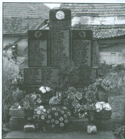
A deportálás áldozatainak emelt emlékművek: Kaplony, Mezőpetri 2008.