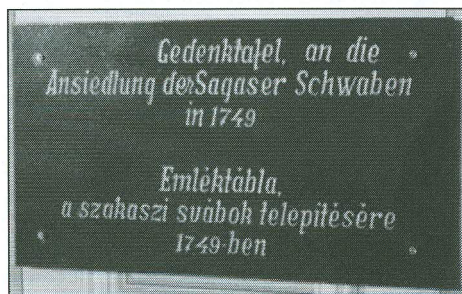
Emléktábla a szakaszi római katolikus templomban. Szakas, 2006.