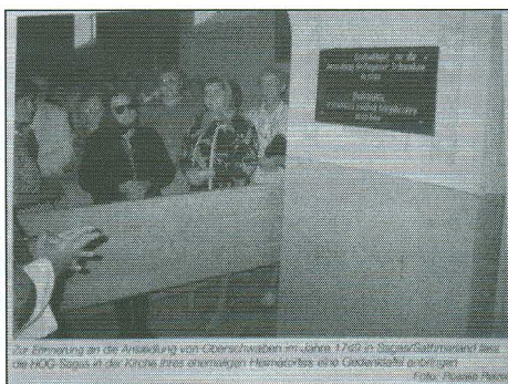
Ugyanazon emléktábla felavatási szertartása. Szakas, 1999. 19

A regionális szintű kollektív telepítési évforduló 2012-ben 300 éves jubileumot jelentett. Az évforduló megünneplésének jelentőségét már a megelőző években láthattuk, hiszen a terephelyszíneken tapasztalt készülődés mellett több tudósításban hallhattunk a szatmári sváb delegáltak látogatásáról, illetve egyeztetéséről a Dunai Svábok Központi Múzeuma ( Donauschwäbisches Zentralmuseum, Ulm ) és a szatmárnémeti Szatmár Megyei Múzeum munkatársaival. A róluk szóló online lapokban megfigyelhető diskurzus nem csak a készülődést és az ünnep jelentőségét tükrözte, hanem a tudatos identitásörzés jellegét is megadta. A megjelent írások főcímei nem feltétlenül a vizsgált csoport egy-egy tagjától származtak mégis a cselekvésre készítetés motiválását érezhetjük bennük. A „ Svábok örömnépe ” 20 , „ Ünnepség a svábok betelepülésének évfordulója alkalmából ” 21 , és „ Az identitás megőrzéséről ” 22 címszavak mind azt jelzik, hogy egy dicsőítésre méltó 300 éves múltra visszatekintő csoport létezik a történelmi Szatmár területén, amely a 21. századelő (számukra) legnagyobb ünnepségére készül.