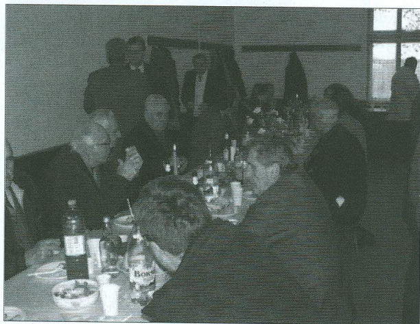
Deportálási emlékmű állíttatását követő ünnepi összejövetel. Kálmánd, 2006.

település is megszervezi megemlékezését, és azt is láthatjuk, hogy mindig van egy-egy település, amely az adott évben vállalja a központi ünnepség lebonyolítá-