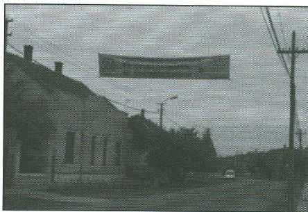
A 300 éves telepítési évforduló. Nagykároly, Csanádos 2012.

Az ünnepségsorozatok kapcsán tehát újra nyilvánvalóvá vált a néprajzi és történelmi tudományos kutatógárda eredményeinek elismertsége a vizsgált csoporton belül, illetve a tudományos feldolgozások eszközszerű alkalmazásának igénye az identitásörzés folyamatában. A kastély ez idő alatt helyet adott egy kisebb kiállításnak is, amely a szatmári svábok tárgyi emlékeit mutatta be. A meghívott vendégek között nemcsak az elszármazottak, illetve az elszármazottak közösségét összefogó Landsmannschaft vezetősége volt jelen, hanem a telepítő grófok leszármazottai is, akik külön program keretében látogatták meg a Mezőpetriben 1995-ben létrehozott sváb tájházat. A programsorozat részét képezte a sváb települések „hagyományörző” csoportjainak felvonulása – a telepítési évfordulók és a sváb találkozók alkalmával már megszokott lokális felvonulások makroszintű formájaként – a sváb tradicionális attribútumok markáns kihangsúlyozása érdekében. A felélesztett fúvós zenekarok részéről ismert polka dallamok hangzottak el, amelyre az egyes településekről delegált, alkalmyszerűen összehívott vagy már néhány éve folyamatosan egyszintű tánc csoportok mutatták be repertoárjukat.