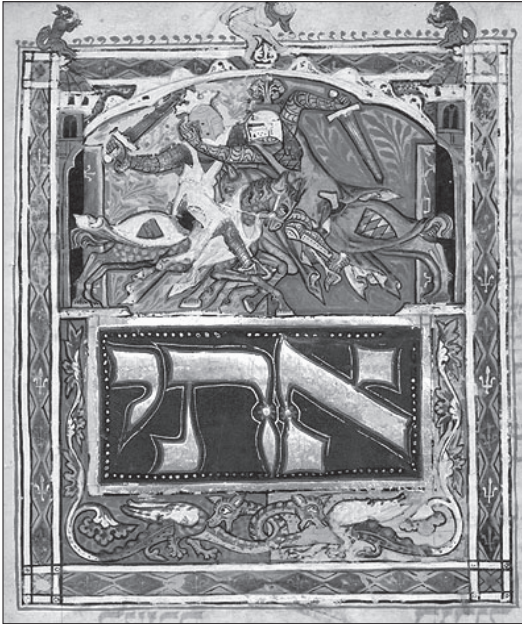
2. kép A mühlendorfi csata a budapesti Kaufmann-gyűjtemény egyik héber kéziratában (MTA KIK MS. A 384, fol. 13v)

nem nézte jó szemmel, hogy az általa el nem ismert uralkodó pápai jóváhagyás nélkül hozza meg döntéseit. Talán e szint mondható a kiállítás legkevésbé változatos egységének: a látvány gyakorlatilag üvegablakok és oklevelek váltakozására épült. A negyedik, „Császárok vagyunk” ( Wir sind Kaiser ) elnevezésű emeleten a kormányzás gyakorlati oldalát ismerhette meg a közönség. A 33 esztendőnyi uralkodás alatt Lajos egyes számítások szerint legalább 80 ezer kilométert tett meg, az általa felkeresett európai településeket a rendezők térképen is megjelenítették. Sajnos azonban az összesítés nehezen áttekinthetőre sikeredett. Ugyanebben a szekcióban kaptak helyet a családtagokkal történő kiegyezések is. Ugyancsak itt állították ki a rendezők a 19. század elején lebontott mainzi Kaufhaus am Brand homlokzatán álló nyolc dombormű (Bajor Lajos, valamint a hét választófejedelem) élethű másolatát is.