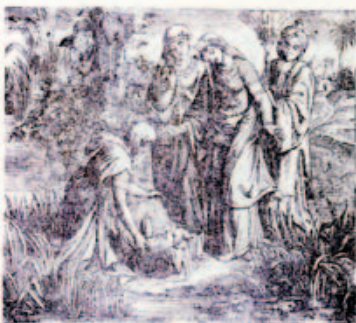
20. Mózes megtalálta a síst körül.