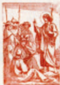
61. Hatalmasnak veszi Simeon a kisdedet a templomban.