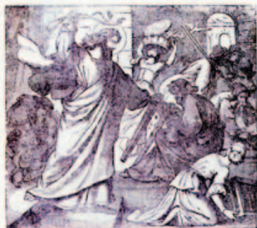
68. Jézus megtisztítja a templomot.