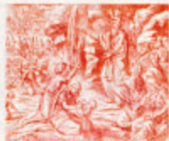
24. Mózes a Iusseli Istiny.