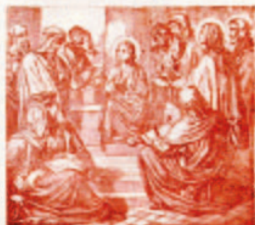
60. A kisdedet bemutatják Simeon a templomban.