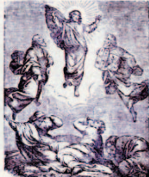
29. Jézus a Tábor-hegyen.