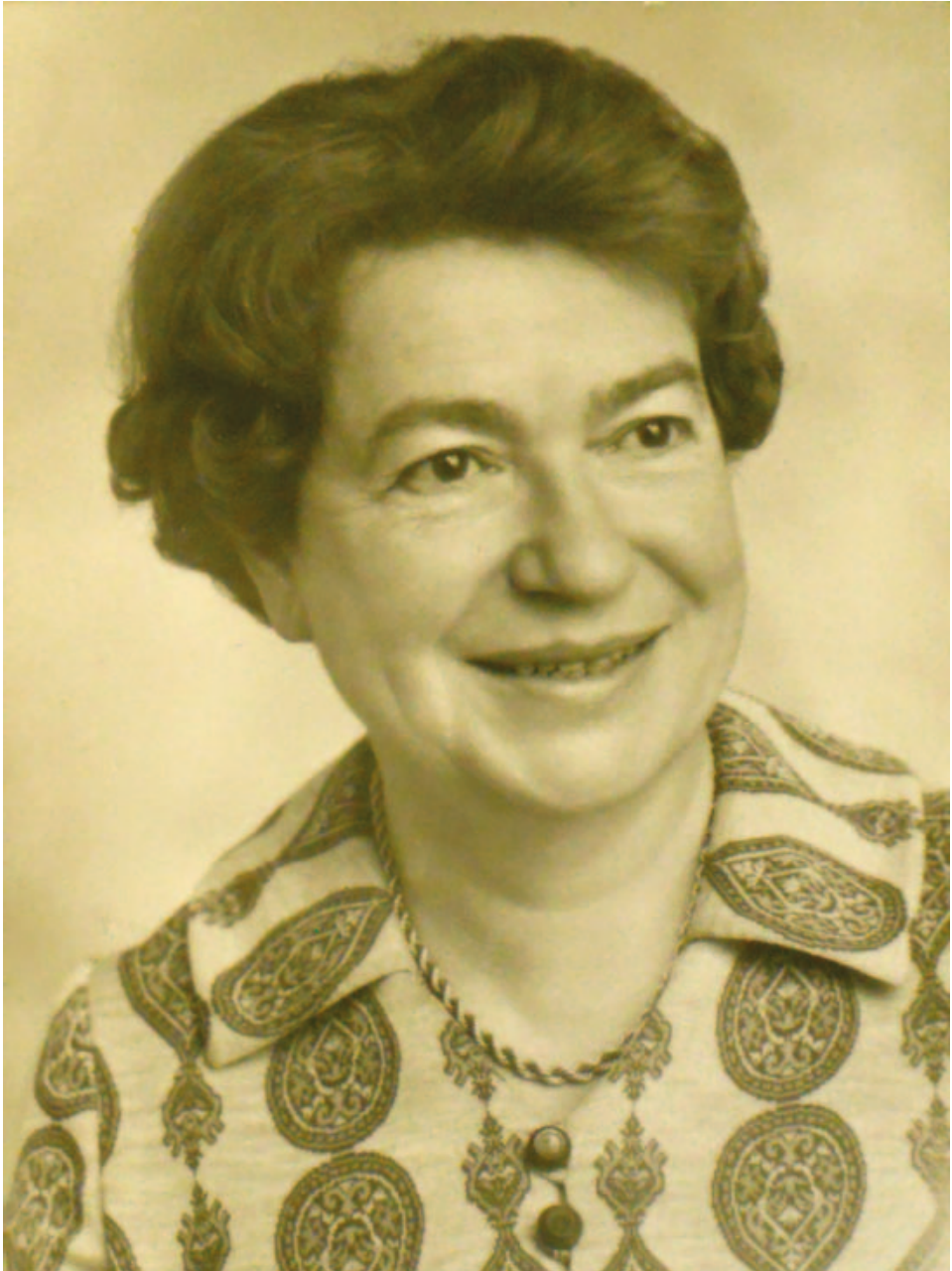
Lugossy Ilona (1923–2010)