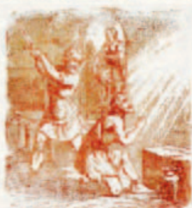
71. A feltámadás.