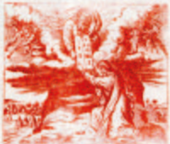
25. Mózes a Iusseli Istiny.

Minden jó keresztény háznál legyen egy Biblia v. Szentírás. Kapható az Egri Nyomda Kiadványosztásánál, Egriben.