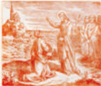
27. Szent Péter az igazat látja leírni.

A Szép Szeztirások az igazat látja leírni. Szent Péter és az igazat látja leírni. Szent Péter és az igazat látja leírni.