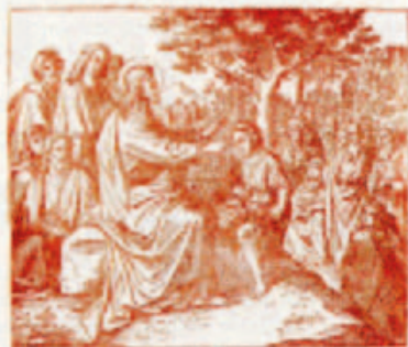
73. A feltámadás.