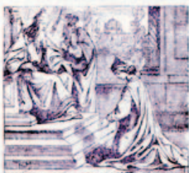
45. Eszter a király előtt.