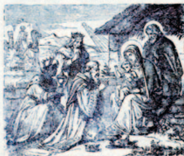
57. A három király a kisded Jézussal.