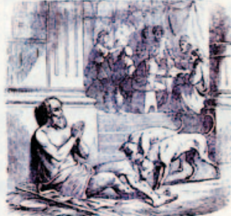
27. A díszes és a nyomorult Lázár.