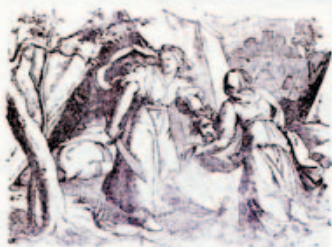
44. István levágya a Hölötemes fejét.

15-ik számú képs mellékel a VERSES SZENTIRASHOZ.