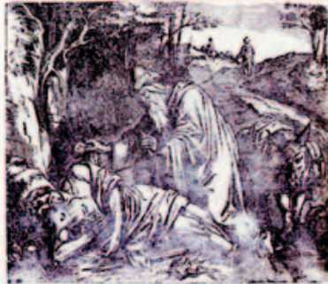
26. Az igazat székbe viszik.