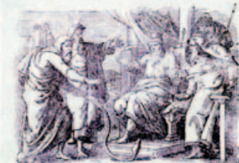
21. Áron Istia kigyóvá változik.