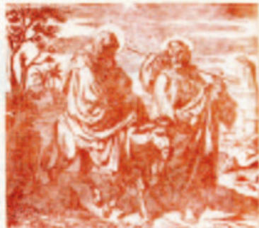
59. A kisded körülmetélése.