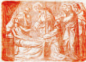
26. Szent Péter és az igazat látja leírni.