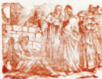
49. A három fiatal ember.

Kiadó: Egri Nyomda Reszvénytársaság, Egerben.