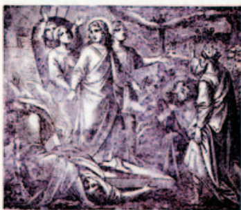
46. A három fiatal ember megmenekülése az égő kemencéből.

A Verses Szentírás és sok százele más ajafos könyvek, füzetek és imádságok az Egri Nyomda Reszvénytársaságnál (Egerben, Gimnázium-utca 3. sz.) rendelhetők meg.