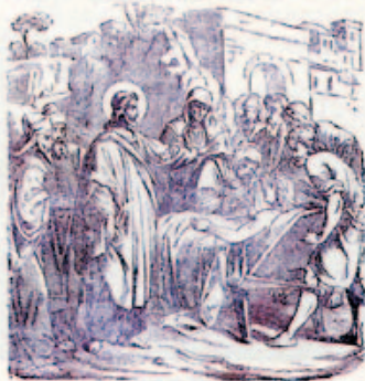
70. Jézus a tanítványokkal beszél.