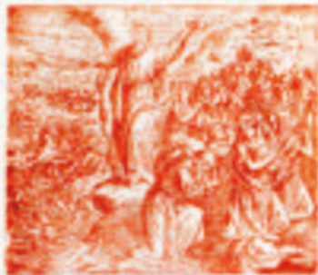
23. A Iusseli Istiny a Iusseli Istiny.