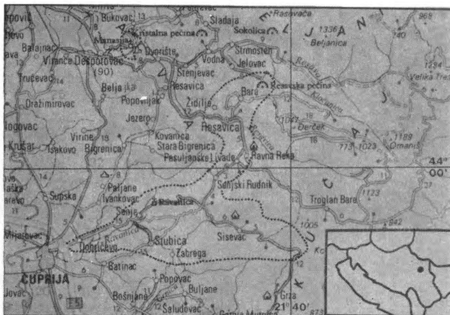
Sl. 1. — Skica istraživanog područja Sketch of the researched area